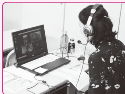
起業家とのグループトークの様子