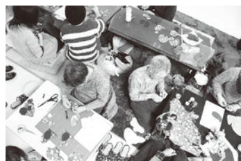
当団体の事務所にて手仕事講座

震災から10年となりますが、避難されてきた方たちの状況は様々で、今も決してよくなったわけではないと思います。深く傷ついた心を元に戻すには時間がかかります。誰かが寄り添って、見守り活動を続けていくことが大事で、これからもみんなで支え合って、「ここがあってよかった。」と喜んでくださる声を心の支えに、現在の活動を続けていきたいと思っています。