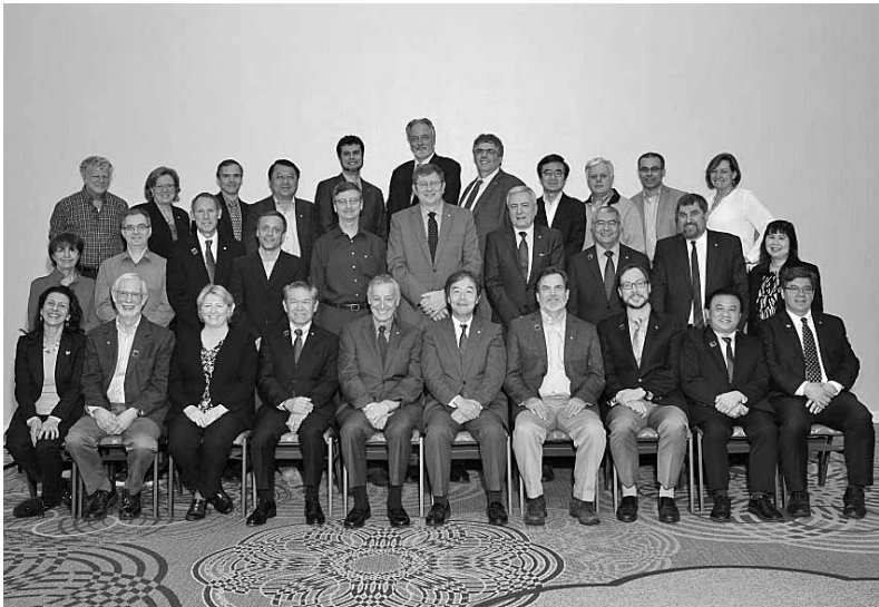
図2 IEEE Computer Society 2017理事会 (Board of Governors)

が会長になるべきとご推薦戴き、会長選挙に参加することになりました。毎年、会長選挙は2名の候補が推薦され、8月始めから9月末くらいの時期に投票を行い決定されます。しかし、米国を中心とした選挙の経験のない小生にとっては、選挙は大変険しく、3年連続推薦して戴き、3回目ですとやっと当選という形になりました。北米外初めての会長として、学会ボランティアの皆様への感謝を明らかにできるシステムの構築、学会雑誌・論文誌・Web・ビデオ及び国際会議等コンテンツのさらなる高品質化・迅速化、各役職の方のニーズに即した企画、大学・産業界における研究開発・教育のさらなる発展、世界の会員の皆様の満足度の向上、IEEE他ソサエティとの連携等に向け、努力を行って行きたいと考えております。