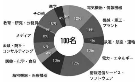
図2 修士課程を修了した学生の進路

さて、皆様のお陰をもちまして、本年度も多くの学生が社会に旅立っていきます。就職する皆さんには、大学で得た知識・経験を存分に活かして4月から活躍されることを期待します。また今後は自身も卒業生として後輩への支援に御協力下さい。最後になりましたが、EWEの活性化委員の方々には、毎年企業見学会や先輩と学生の交流会を開催して戴いており、学生にとっては貴重な就職活動の機会を提供して戴いております。この場をお借りして御礼を申し上げます。今後とも引き続き御指導・御鞭撻の程宜しくお願い致します。