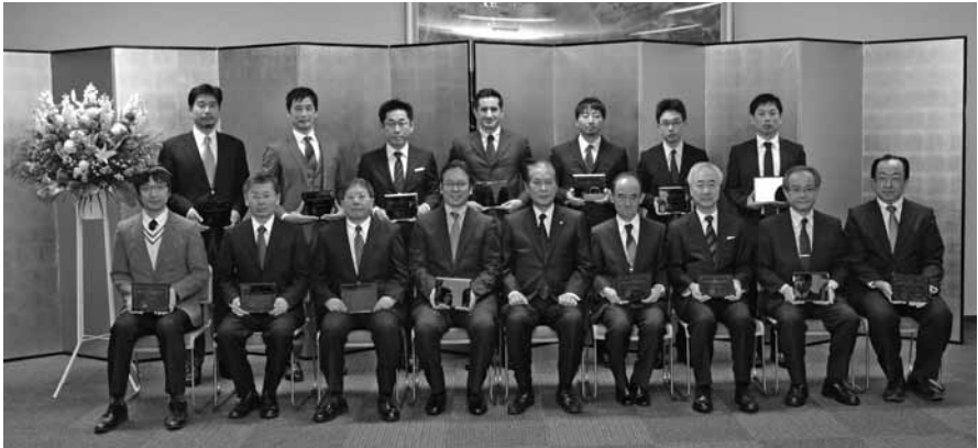
授賞式記念撮影（リサーチアワード）

う快挙となりました。このことは、教育面、研究面においてEWEが早稲田大学をリードしていることを示しております。