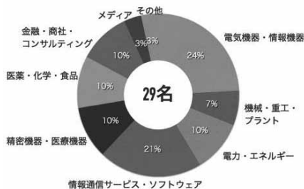
図1 学部卒業生の就職先

本年度の就職・進学状況の概要は以下のとおりです。2016年度卒業を目指して卒業研究に取り組んだ学部学生は133名ですが、このうち99名が進学し、その大部分が卒業研究で所属した研究室に進学し、引き続き研究を行う予定です。また就職が決まっている学生は29名で、その内訳は図1のようになっています。一方、大学院で修士論文に取り組んでいる学生は100名ですが、修士課程を修了して就職予定の学生は94名で、その内訳は図2のようになっています。就職先は学部・大学院ともに御覧のようにメーカーから医療・金融業界まで多岐に渡ります。この幅広い分野への就職は、設備・機械のIT化や事業の多様化にともない電気・電子・情報工学の素養を持つ人材は依然として人気があり、また従来市場の成熟に伴い新規市場を開拓する必要からメーカー系は積極的に医療・生命科学分野への応用を模索し始めたという昨今の状況が後押ししていることもあります。多様な研究活動を行う研究室を有する本学科・専攻の一つの特徴となっています。