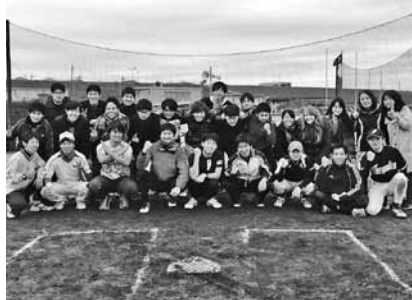
優勝した若尾研究室のみなさん

午後の試合は午前中に勝ち残ったチームによる決勝トーナメントになります。優勝を目指す強豪がしのぎを削り、練習の成果を遺憾無く発揮していました。決勝戦ではチームの声援や捕手がボールを取る音まで聞こえてきていて、選手はもちろん、ベンチも活気に満ち、研究室全体が優勝を目指しているように感じました。残念ながら午前中で敗退してしまっ