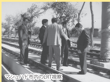
マシュハド市内のLRT視察