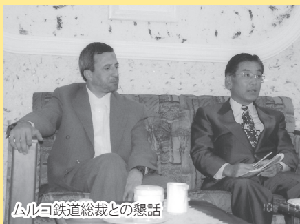
ムルコ鉄道総裁との懇話