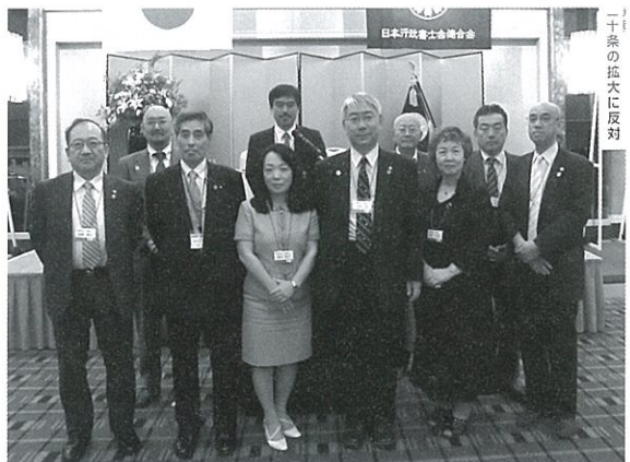
北海道会役員一同