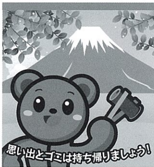
今号の表紙 『富士山』

富士山が世界遺産に登録されました！ 登録といえば、僕も登録されているんだよ。商標登録だけだ。。。下のコラムとイラストも要チェックだよー いつかは世界遺産になりたい、たくまでした。