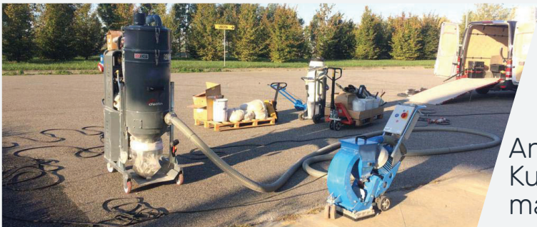
Anwendung mit Kugelstrahlmaschinen