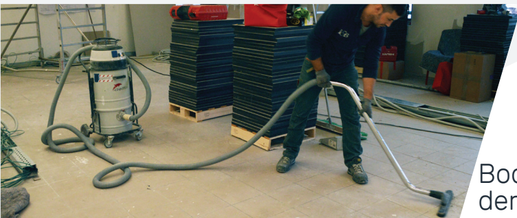
Bodenreinigung nach der Bodenbearbeitung