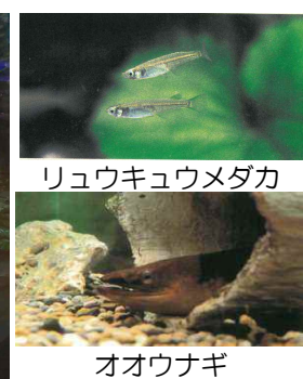
リュウキュウメダカ