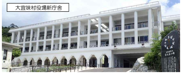
大宜味村役場新庁舎

大宜味村役場の新庁舎が5月8日に落成（建て替え）されました。新庁舎は、国指定重要文化財の旧役場庁舎の形状を取り入れたデザインにしています。3階村民テラスからの眺望がとても良いので、北部に足を運んだ際には訪問してみても如何でしょうか（興味深く感じる事でしょう） ※「新庁舎」・「旧庁舎」・「旧村議会棟」は隣接しています。