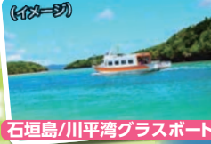
石垣島/川平湾グラスボート