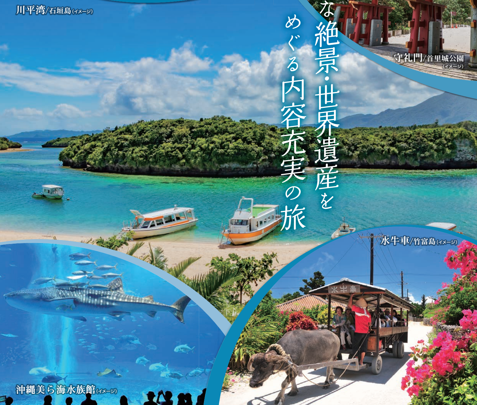
沖縄美ら海水族館(イメージ)