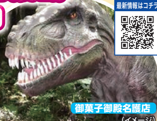
御菓子御殿名護店 (イメージ)