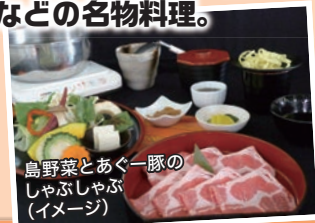
島野菜とあぐー豚のしゃぶしゃぶ (イメージ)