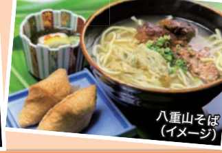
八重山そば (イメージ)