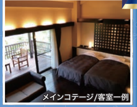
メインコテージ/客室一例