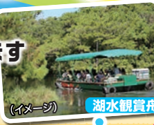
湖水観賞舟 (イメージ)