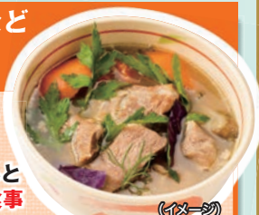
県産豚のやんばる鍋 (イメージ)