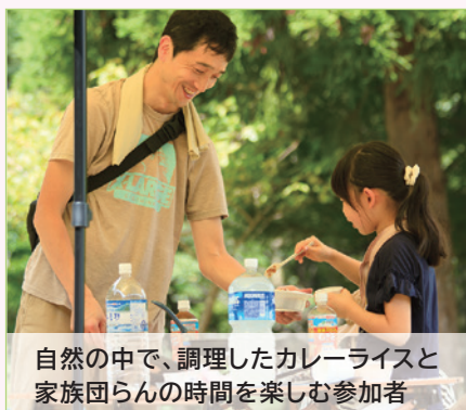
自然の中で、調理したカレーライスと家族団らの時間を楽しむ参加者

今回紹介するのは、親子でクイズと野外調理を楽しめるイベントを企画した「大小屋キャンプ実行委員会」です。 「この活動に取り組んだのはなぜですか？」 「大小屋キャンプ場」という場所の魅力を伝えたいと思ったからです。 大小屋キャンプ場は大内地域の中でも「知る人ぞ知る」場所になっていました。私自身やメンバーの中にも最近存在を知ったという人もいましたが、実際に行ってみると景色が素晴らしい、この場所をたくさんの人に知ってもらいたいと思い、興味を持ってもらおうきっかけを作ろうと活動に取り組みました。