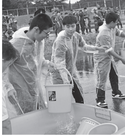
初期消火訓練の様子