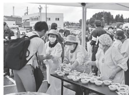
炊き出し訓練の様子

などが行われました。小中学校では避難所運営や応急手当訓練、消火器による消火体験などが行われ、児童生徒たちが真剣に訓練に取り組む様子が見られました。