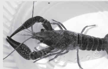
アメリカザリガニ