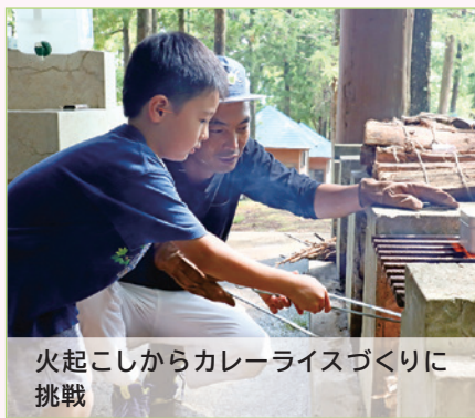
火起こしからカレーライスづくりに挑戦