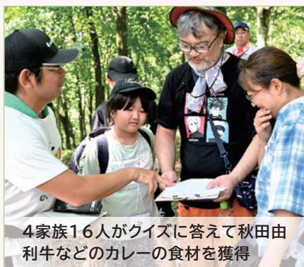
4家族16人がクイズに答えて秋田由利牛などのカレーの食材を獲得