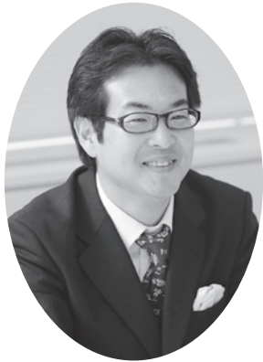
歴史作家 河合敦さん