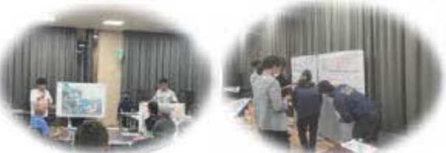
あやはしまちづくり会議の様子