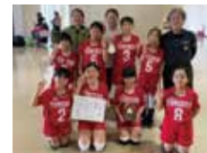
豊見城団地クラブ