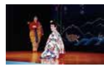
▲唱え、踊りを行う立方