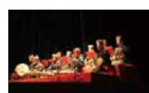
▲音楽を演奏する地謡