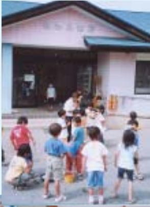
▶子どもたちで賑わう児童館 (シャボン玉あそび)

小学校からは地下道で通じており、安全面ではとても恵まれていきます。周囲は木々に囲まれ、春は桜、秋は色鮮やかな紅葉など、四季を通じて環境にもよい所です。そんな児童館に毎日、一年生から三年生までの約90名ほどの子どもたちが来館しており、ドッジボール、野球、一輪車、バドミントン、縄跳びなど、遊戯室で遊ぶ子どもたちの明るい声が響き渡っています。また、館内の部屋では、宿題をしたり本を読んだり、トランプやぬり絵で遊んでいます。また、年間行事ではフアツ