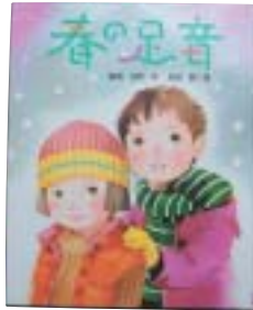
那須 正幹：作 榎ポプラ社発行