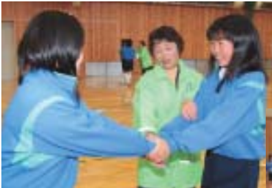
▲学校・市民・警察が一体となつて実施した護身術訓練（北御牧中学校）▶