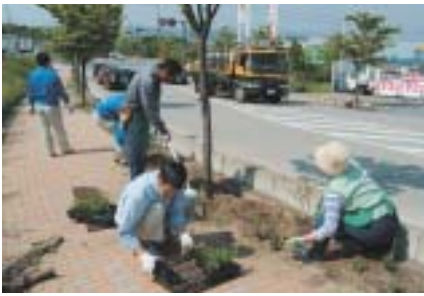
▲「緑のサポーター」の皆さんによる美化運動

県民税を天引きされる方には適用がなく公平でないことなどの理由から、全国的に制度の廃止が進められました。市におきましては、東部地区は昭和55年度に、北御牧地区では合併を期に廃止されました。納税者の皆さんには、制度の廃止につきましてご理解をいただきますとともに、市では口座振替による納税を推進しておりますのでご検討をいただき、納期内の納付に一層のご協力をお願いします。