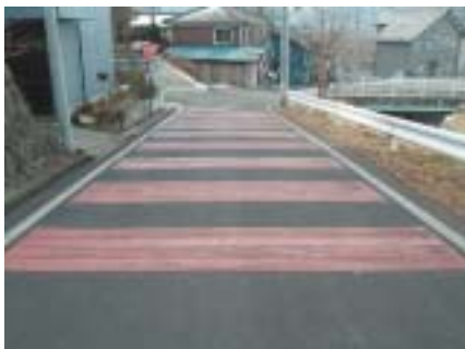
▲滋野駅北側市道のカラー舗装

なっていて、歩きにくく転びやすい箇所があるが改善を図つたらどうか。」滋野駅北側の市道について、寒さから駅への車両が多くなり、歩くことが危険な感じがする。路面凍結・積雪による車両の滑り止め対策を施し、歩行者の安全確保を第一に考えたらどうか。」など、住民の皆さんが実際に危険な経験をした内容から、市民の安全確保についての提言が寄せられました。早速現場調査を行い、両箇所とも多くの市民が通学や通勤で利用する危険な箇所であることを確認し、関係区と協議の改善を図りました。