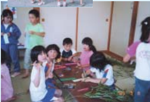
▶七夕まつりの準備をします

児童館には、「あいさつを元氣よくしましょう」「後片付けをしよう」「皆と仲良く遊びましょう」などの決まりがありますが、これらを守るよう指導して良い行動はほめ、やる気と思いやりのある子どもに育ってほしいと願っています。これからも子どもたちに愛され親しみのある児童館を目指しさらに頑張りたいと思います。