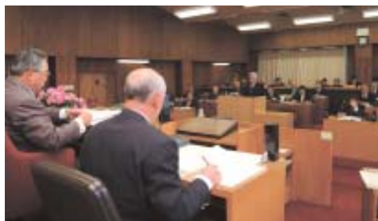
▲市議会における一般質問