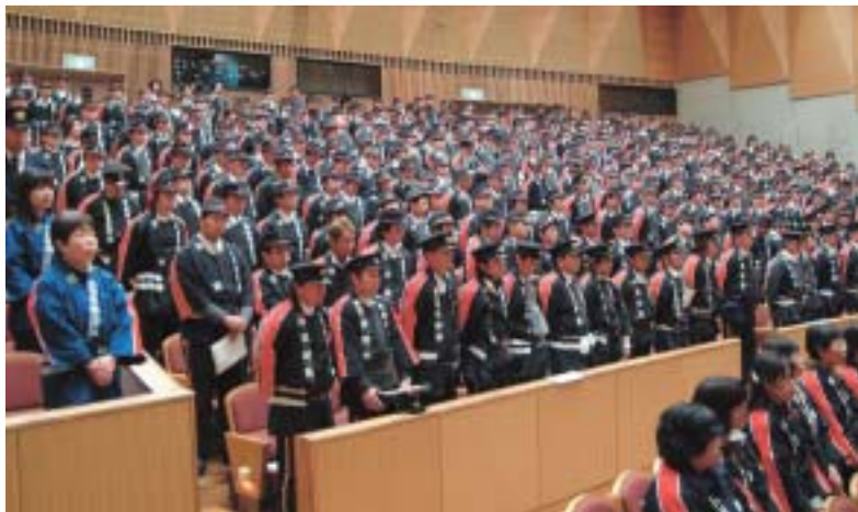
▲一致団結する団員

隊を先頭に消防団、自衛消防隊約650名の皆さんや、積載車、タンク車などが続々と行進。風船などで飾られた積載車を見て子どもたちが大きな歓声をあげる一幕もありました。その後、サンテラスホールに会場を移して、消防音楽隊・ラッパ隊によるアトラクションの後に式典を開催し、功労のあった団員などの表彰が行われました。団員は新年にあたり地域を守る使命感を新たにしていました。