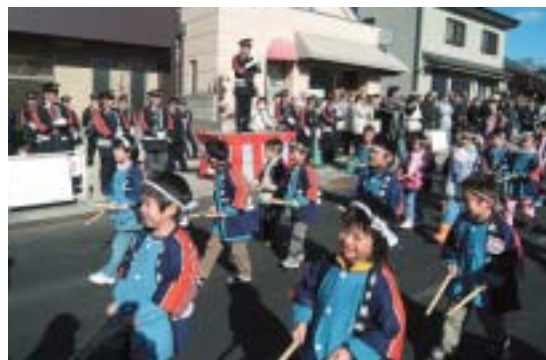
▲幼年消防クラブの皆さんによる行進