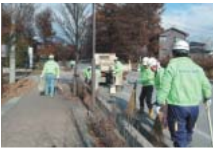
▼東御市建設業協会の皆さんによるクリーンアップキャンペーン