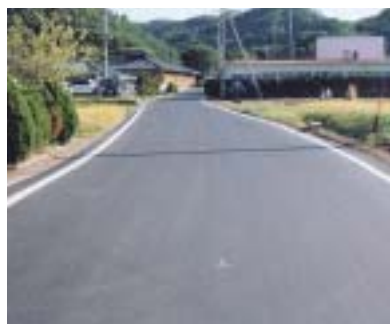
▲市道中堀線舗装修繕工事