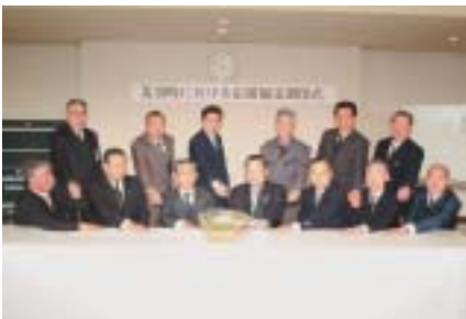
▲災害時における応援協定を調印