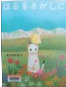
亀田亜希子：作・絵 榎文溪堂発行