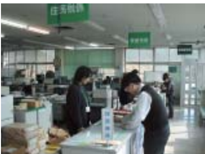
▲税務課窓口のようす