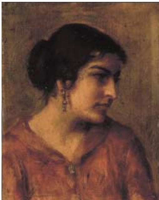
「西洋婦人」油彩、板 30.0cm×26.5cm (作者不詳)

昭和60年(1985)4月、定年を機に私は東京・京橋に「美術研究所藝林」を開設し、美術を私なりに研究し世に問う仕事を始めました。よくいわれる「第二の人生」です。今振り返ってみると、現在の絵画館に移るまでの藝林時代の12年間に、本当の意味で実りある人生を得たと思います。