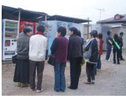
▼自販機チェック活動