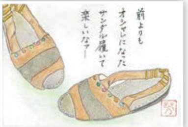
古くなり捨てられる運命のサンダル復活♪♪ 頃常 芳子（今・今津）