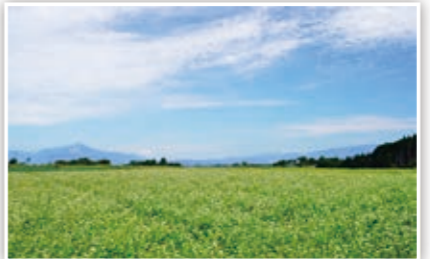
秋空の下、実ったソバの花が、まるで真っ白なじゅうたんみたいやなあ〜♪ たかP

スマートフォンや携帯電話などからの応募も大歓迎！また、市ホームページではカラーで掲載！