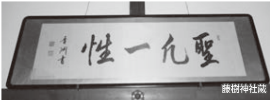
聖凡一性（聖人も凡夫も同一平等である）

『論語』などを読んで学問に励みました。そうして培った教養を生かし、14歳の頃には難しい藍の買いつけを成功させるなど、農家としての経験を積んでいきました。のちに、京都御所の警護をしていた一橋慶喜（のちの15代将軍）に仕える武士となり、江戸幕府終焉後には明治政府の大蔵省で日本の財政の一端を担いました。明治6年（1873）に大蔵省を退所すると、日本初の銀行である第一国立銀行（現在のみずほ銀行）を創立し、他にも300社以上の企業設立に関与する実業家へと転身しました。