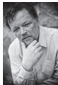
ニコライ・デミジェンコ

昨年、ワルシャワで行われた「ショパン生誕200年 ガラ・コンサート」にも出演を要請され、その腕前を披露したほどの演奏を、どうぞ、お聴きください。