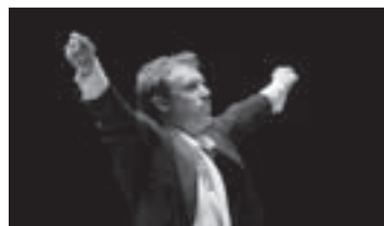
ダニエル・ハーディング

この公演の収益は被災地復興への義援金に充てられます。一人ひとりの小さな力が合わさって大きなエネルギーを生み出すオーケストラ。復興への道のりも同じことだと信じ、一人ひとりの祈りと力を音に乗せて、被災地へ届けます。