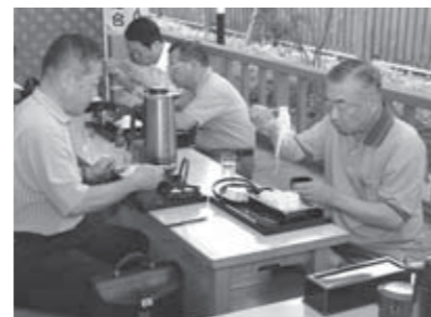
▲8月7日に開催された試食会の様子

現在メニューは3種類ですが、うーめんの本質に立ち返った自慢の味を皆さんに提供します。ご家族おそろいで、ぜひお立ち寄りください。