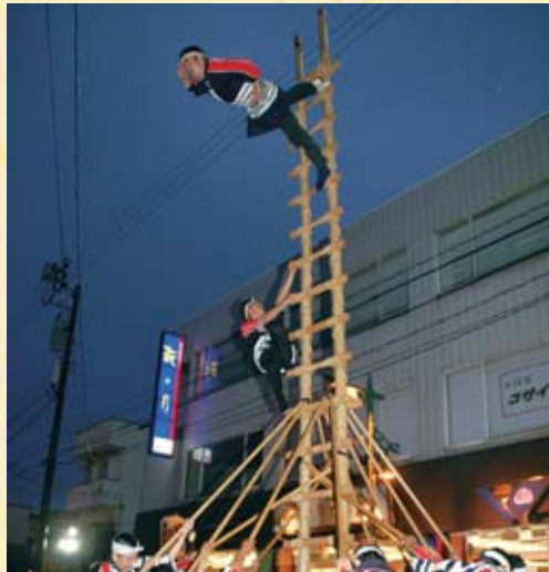
▲白石市消防団はしご乗隊により「伝統はしご乗り」が披露されました！