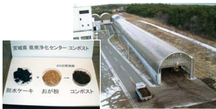
▲脱水ケーキとおが粉を混ぜ、25日間発酵させてできるコンポスト

詳しくは、宮城県中南部下水道事務所総務管理班（☎022-1367-4001）までお問い合わせください。 ●配布時間 月～金曜日 9時～16時 ※祝日を除きます。