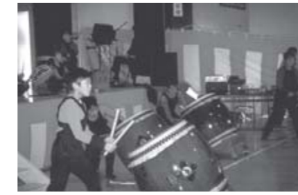
▲新春芸能の祭典・大鷹沢子ども太鼓