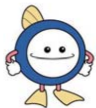
▲下水道マスコットキャラクター「スイスイ」

この「下水道の日」を迎えるに当たり、下水道の果たす役割やその大切さなどについて、改めて見つめ直してみてはいかがでしょうか。