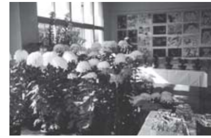
▲力作が勢ぞろいの文化祭