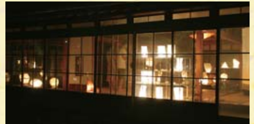
▲壽丸屋敷で開催された「白石和紙あかり展示会」