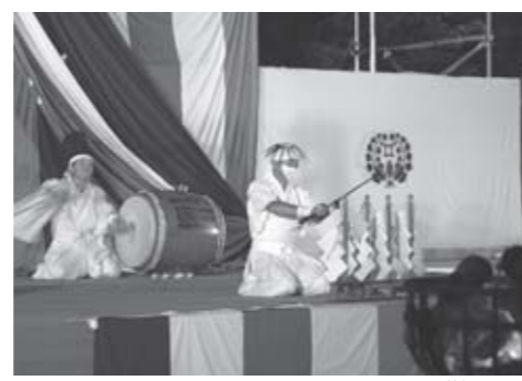
▲今年5月に市の民俗文化財に指定された禰流大町神楽

この大鷹沢地区には古い歴史がたくさんあり、地元の若い人たちがこれらの歴史を継承し守っています。伝統ある歴史を一人でも多くの皆さん方に知っていただくよう、広報活動を進めていきます。