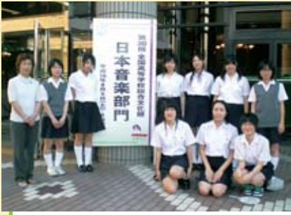
▲ 箏曲会場の長岡京記念文化会館で記念撮影!