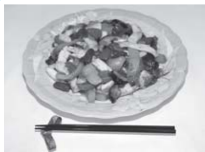
エネルギー81kcal/たんぱく質10.5g/塩分1.7g