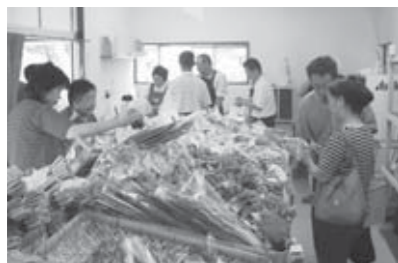
▲補助金を活用してオープンした馬牛沼産直センターの盛況ぶり

市では、各地区のまちづくり協議会やコミュニティセンターの皆さんが、地域に根ざした文化やスポーツ、生涯学習などを自ら企画・運営し、「地域主導型の地域づくり」推進を目指す各種事業を応援するため、補助金を交付しています。