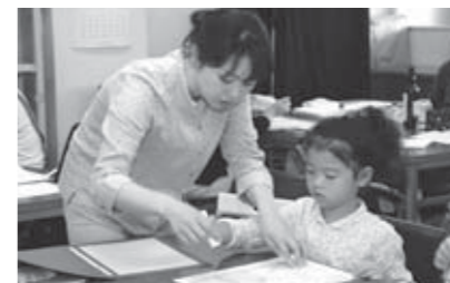
▲親子で絵本作りに楽しく挑戦！

8月1日、毎年恒例の手づくり絵 本講習会を開催しました。講習会に は市内の小学生とそのお母さんなど 20名が参加。事前に参加者の皆さ んが思い思いに描いたものを一枚一 枚、丁寧にのり付けするといった作 業を行い、3時間ほどで次々とオリ ジナル絵本が誕生しました。