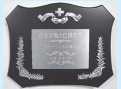
▲7月3日、東京都千代田区において、厚生労働大臣より授与された楯

平成18年度「安全衛生に係る優良事業場、団体又は功労者に対する厚生労働大臣表彰」で、ソニー白石セミコンダクタ(株)が「優良賞」を受賞しました。 「安全衛生に係る優良事業場」とは、安全衛生水準が極めて高く他の模範と認められる事業場であり、毎年、厚生労働省が認定し表彰を行っているものです。 全国の事業所から、「優良賞」として11事業所が選ばれ、宮城県で唯一の「優良賞」を受賞しました。 ソニー白石セミコンダクタ(株)では、独自の安全衛生マネジメントシステムの運用と年間計画の作成や安全管理者、衛生管理者、産業医の職務徹底、健康管理室の設置や保健師による労働者の健康管理徹底(健康診断のフォローや面談などの実施)労働災害無災害の継続など、合計10以上の項目について高い評価を受け、今回の受賞となりました。 この度の受賞、誠にありがとうございます。 これからも、労働災害のない安全な事業所でありまます、今後もよろしくお願ひします。