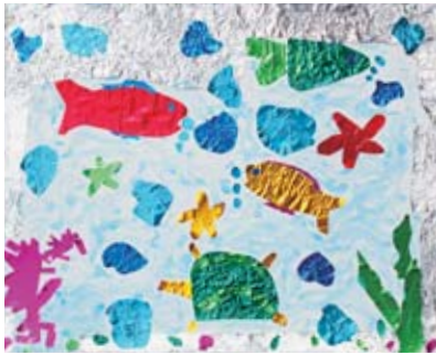
※テーマは「キラキラ光る絵」です。