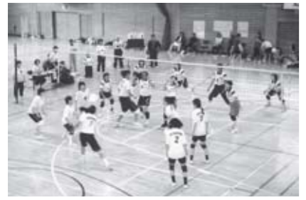
▲練習の成果を発揮・地区民球技大会

いずれも歴史があり、観桜会は来年50年目を迎えます。地区民の親ぼくと融和を図る場として先輩方から引き継がれてきた大切な行事です。こうした財産を守りながら、特色あるまちづくりを推進していくため、今後とも頑張っていきたいと考えています。