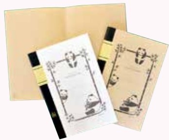
▲竹紙100ノート (中越パルプ工業(株)川内工場提供)

※うぶごえとおくやみは、本庁市民課または各支所、甌島振興局などに届け出(出生・死亡)をされた方で、広報紙への掲載に同意された方のみを掲載しています。