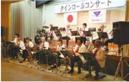
【情報提供：薩摩川内政経クラブ】

会員と一般客約 100 人の前で、昭和歌謡やジャズ、ダンス曲などが演奏され、円熟した音色で会場を盛り上げました。