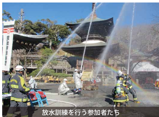
放水訓練を行う参加者たち

雨引山楽法寺で文化財防火訓練実施 大和地区の雨引山楽法寺で、文化財防火デー当日に防火訓練を実施しました。 文化財防火デーは、昭和24年1月26日に法隆寺（奈良県斑鳩町）の金堂が炎上し、壁画が焼損してしまったことを教訓にして制定されたものです。 当日は、筑西広域消防本部・地元消防分団、本木1区・2区の皆さんが参加し、消火訓練などを行いました。