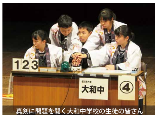
真剣に問題を聞く大和中学校の生徒の皆さん

いばらきっ子郷土検定県大会に 大和中が出場 県内の中学2年生を対象に、郷土への愛着や誇りを高める「いばらきっ子郷土検定県大会」が、茨城県立県民文化センターで開催され、大和中学校の5人の生徒が出場しました。 市の代表として出場した大和中学校は惜しくも予選で敗退しましたが、参加した生徒は「茨城について色々なことが知れてとても面白かった」と嬉しそうに話していました。