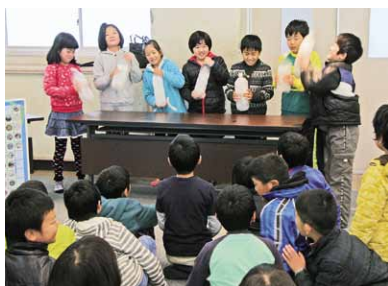
市内小学校で開催している下水道の仕組みを学ぶ講座

◆企業誘致および新産業の育成 進出企業に対する税制上の優遇制度、市内の遊休地情報を発信し、新たな雇用の確保ができるよう、引き続き企業誘致を推進してまいります。 また、桜川筑西インターチェンジ周辺地区整備計画につきましては、総合的な整備を実施し、企業が進出しやすい環境づくりを進めてまいります。