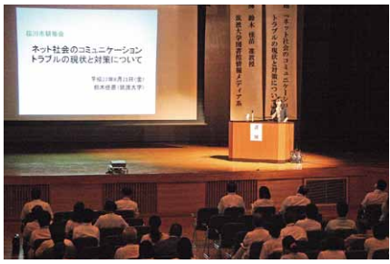
人権教育講演会などを開催し、人権尊重のまちづくりを推進

◆人権尊重のまちづくり 人権について理解していただくため、啓発・キャンペーンを人権相談と合わせて引き続き行ってまいります。