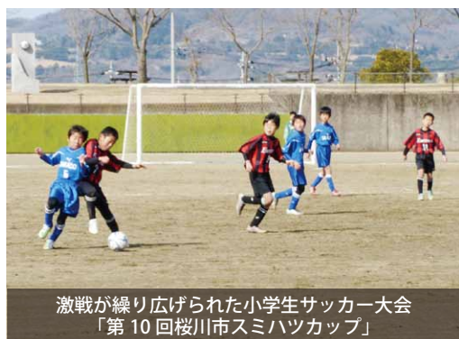
激戦が繰り広げられた小学生サッカー大会「第10回桜川市スミハツカップ」

サッカー大会 「第10回桜川市スミハツカップ」開催 桜井農村公園などを会場に、小学生サッカー大会「第10回桜川市スミハツカップ」が2日間行われました。 本大会は、株式会社スミハツ（台山高森工業団地内）が地域貢献の一環として毎年開催しているもので、今年で通算22回目。当日は、市内4チームをはじめ近隣の市町から、総勢24チームが参加し、激戦を制したJSCしもつまが優勝しました。