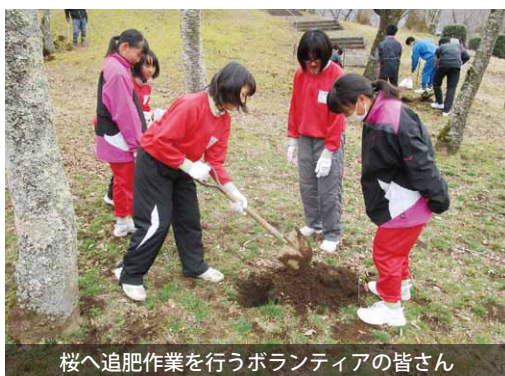
桜へ追肥作業を行うボランティアの皆さん

磯部桜川公園の桜に ボランティアが追肥作業 サクラサクリプロジェクトと桜川日本花の会は、国の天然記念物「桜川のサクラ」に元気を取り戻そうと、ボランティアを募り、磯部桜川公園の桜に追肥作業を行いました。 当日は、岩瀬東中学校の1・2年生や地元住民など約40人が参加。樹木医の指導の下、桜の根元にスコップで穴を掘り、肥料を与えました。 両団体は、この取り組みを今後も継続していく予定です。