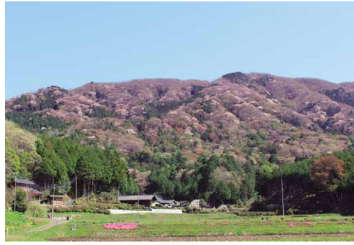
市内の磯部地区や高峯・雨巻山、雨引山・筑波山の山麓地帯などに、多くのヤマザクラが咲き誇ります。(写真/高峯のヤマザクラ)