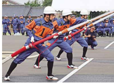
平成27年消防操法県西地区大会で、桜川市消防団が優勝

災害に強いまちづくりを進めるために、非常時の対応・体制の強化や防災施設などの整備を図り、自主防災組織の育成強化・防災意識の高揚や、災害時における行動力の強化に努めてまいります。 また、消防防災体制の充実を図るため、消防団、自主防災組織の育成に努め、市民の皆様と連携を図ってまいります。