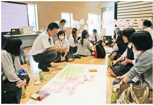
皆様からご意見をいただきながら、「桜川市まち・ひと・しごと創生総合戦略」を策定し、将来を見据えたまちづくりを進めていきます。(写真/高校生ワークショップ)

◆健康づくりの推進 生活習慣病・感染症などの疾病予防やこころの健康保持についての意識啓発に取り組み、市民一人ひとりが「健康