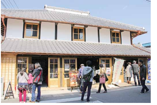
東日本大震災で被災した真壁地区の歴史的建造物の復旧を推進しています。復旧された建造物は、イベントなどに活用されています。(写真/平成27年1月に復旧を終えた旧高久家住宅)

次に、教育内容の充実につきましては、国際化・情報化時代に対応する力をつける英語・情報教育の環境を整備するため、外国語指導助手や教育補助員並びにコンピュータ教室の充実を図ってまいります。 さらに、児童・生徒の心の悩みや不安を相談できる適応指導教室の充実を図り、不登校・ひきこもり問題の解消に努めてまいります。 ◆生涯学習・芸術文化活動の推進 真壁伝承館、岩瀬・大和中央公民館において、生涯学習の拠点となる講座・イベントを開催し、市民の学習・文化活動に対する意識啓発を図るとともに、市民が主体となつて行なう芸術・文化活動の成果発表などを支援してまいります。 ◆生涯スポーツ活動の振興 子どもたちから高齢者まで、幅広くスポーツに取り組める環境づくりに努めてまいります。 ◆文化財の保存・活用 震災により被害を受けました真壁地区の歴史的建造物につきましても、引き続き国・県