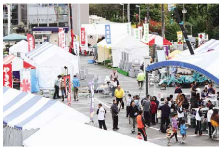
石材加工品を展示して、地場産業の石材業をPRする「大和の石まつり」

入型商業機能の活性化を図るとともに、地元商店街の購買力の向上を図ってまいります。 また、市のシンボリックな地場産業である石材業につきましても、市内外の石材関係団体と連携し、PRに努めるとともに、実態を把握し、石材製品の市場や販路の拡大を推進し、生産地としての確立と活性化に努めてまいります。