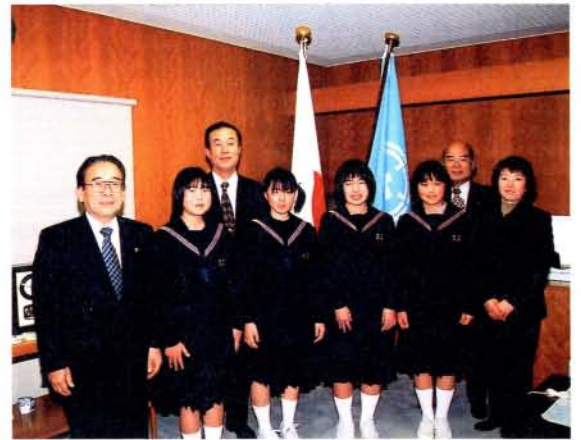
第27回九州アンサンブルコンテストに出場した郡中学校吹奏楽部(クラリネット四重奏)の皆さん(1/30・市役所)