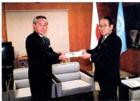
九州電力大村営業所から公衆街路灯など計10基を寄贈いただきました。(12/15・市役所)