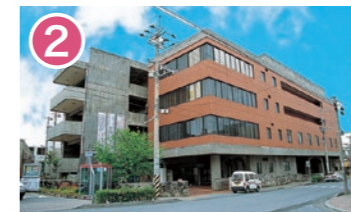
2 沖縄市文化センター 沖縄市上地 2-19-6 郷土博物館・芸能館があり、市民に広く活用されています。 Okinawa City Cultural Center Home to a local museum and entertainment hall widely used by citizens.