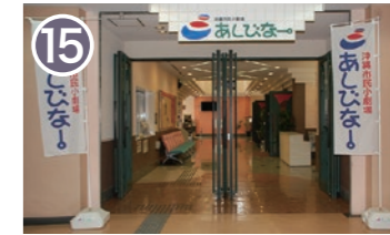
15 沖縄市民小劇場あしびな 沖縄市中央 2-28-1 3階 沖縄芝居や古典芸能、映画上映やライブ、多彩なジャンルの講演が行われている劇場です。 Okinawa City Small Theater Ashibina A theater where Okinawan plays, classical performing arts, movie screenings and live performances and lectures in various genres are held.