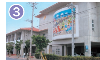
3 沖縄市福祉文化プラザ 沖縄市高原 7-35-1 保健・福祉の総合施設で、子どもから高齢者まで誰もが気軽に利用できます。 Okinawa City Welfare and Culture Plaza A comprehensive health and welfare facility where anyone from children to the elderly can use at ease.