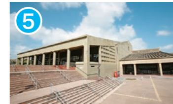
5 沖縄市民会館 沖縄市八重島 1-1-1 芸術文化の発表、鑑賞の場として市民に幅広く活用されている多目的ホールです。 Okinawa Civic Hall This multi-purpose hall is widely used by citizens as a place to present and appreciate the arts and culture.