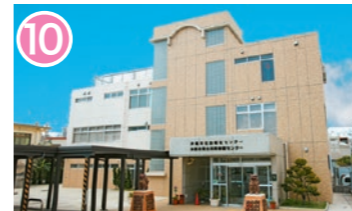
10 沖縄市社会福祉センター 沖縄市男女共同参画センター 沖縄市住吉 1-14-29 社会福祉センターと男女共同参画センターの総合施設で、市民活動の拠点の一つとなっています。 Okinawa City Social Welfare Center Okinawa City Gender Equality Center It is a comprehensive facility housing the Social Welfare Center and Gender Equality Center and provides many social activities for citizens.