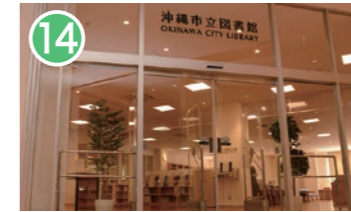
14 沖縄市立図書館 沖縄市中央 2-28-1 1階 2017年に移転開館。ワンフロアの図書館としては九州最大規模の広さを有し、自主的学習スペースも無料で利用できます。 Okinawa City Library Relocated and opened in 2017. It has the largest floor space of all libraries within the Kyushu area. Provides free independent study spaces.