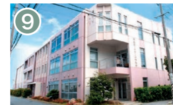
9 沖縄市ITワークプラザ 沖縄市泡瀬 3-47-10 情報通信技術を活用した場所を提供することにより新たな雇用機会の創出を図っています。 Okinawa City IT Work Plaza We aim to create new employment opportunities by providing places using information and communication technology.