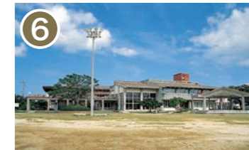
6 沖縄市農民研修センター 沖縄市字登川 2380 農家のための教育研修の場。福利増進や農業振興の情報交換を行う場になっています。 Okinawa City Agricultural Training Center A place for education and training for farmers. A place to exchange information on welfare and agricultural promotion.