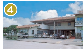
4 かりゆし園 沖縄市知花 6-36-17 高齢者の健康増進や教養娯楽提供など、健康で明るい生活を営んでもらうための施設です。 Kariyushi En A facility designed to promote healthy and cheerful lifestyles by promoting elderly healthcare and providing educational and entertainment services to citizens.