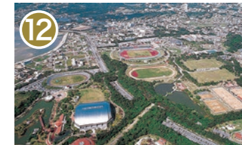
12 沖縄県総合運動公園 沖縄市比屋根 5-3-1 運動施設やキャンプ場が完備。ジョギングやウォーキングの場としても親しまれています。 Okinawa Comprehensive Athletic Park Fully equipped with athletic exercise facilities and campsites. It is also popular as a place for jogging and walking.