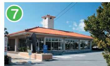
7 沖縄市産業交流センター 沖縄市泡瀬 1-11-25 東部地域の拠点を形成するための施設。企業の研修や地域住民の交流の場になっています。 Okinawa City Industrial Exchange Center Facilities based on the city's eastern region, functions as a site for corporate training and local residents.