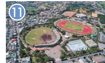
11 沖縄市立総合運動場 沖縄市諸見里 2-1-1 市民の健康づくりやスポーツ活動、競技スポーツの場として幅広く活用されています。 Okinawa City Koza Sport Park Widely used as a place for citizens' health promotion, sports activities and competitive sports.