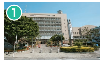
1 沖縄市役所 沖縄市仲宗根町26-1 沖縄市の中枢機能の役割はもちろん、情報発信や市民の交流の場にもなっています。 Okinawa City Hall Plays a central role in city administration and functions, but also serves as a forum to provide information to its citizens and social exchange.