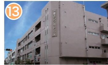
13 沖縄市テレワークセンター 沖縄市中央 1-32-7 市民等に情報通信技術を活用した場所を提供し、新たな雇用機会の創出と地域の活性化を図っています。 Okinawa City Telework Center Providing citizens with places that utilize information and communication technology to further revitalize local communities.