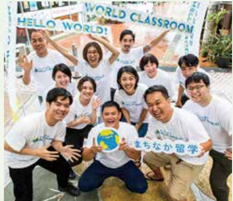
▲手前の左から2番目