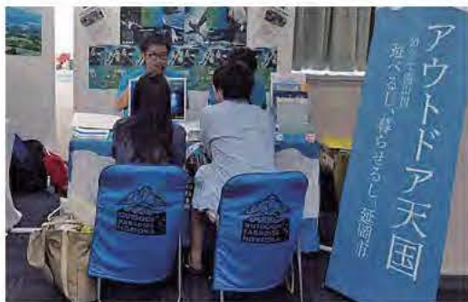
▲移住相談員が延岡暮らしの魅力をお伝えします！