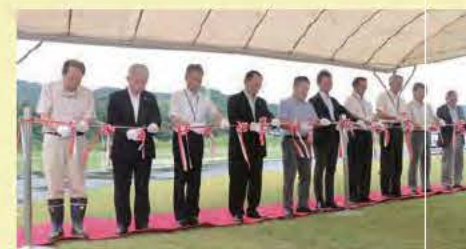
6月30日(日)に、関係者約50人が出席し、完成式典が行われました。

このバーベキュー広場は、市内の農林水産物の消費拡大や自然とのふれあいなどを目的に、国土交通省と市で整備しました。この夏は家族や友人と美しい川を眺めながら、バーベキューを楽しみませんか？