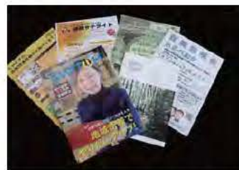
▲市内高等学校を卒業した人には、自宅に企業情報や就職情報などを年に1回程度お届けしています。

詳しくは商業・駅まち振興課 ☎(0982) 3417841 までご相談ください。