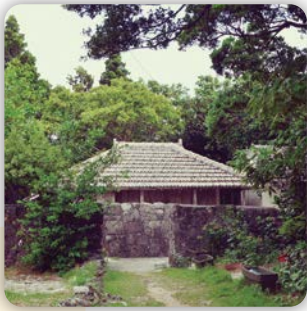
島で一番古い家？ #大里家（うぶらとう） #国王と美人ノロとの悲恋