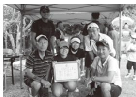
【準優勝】新開チーム