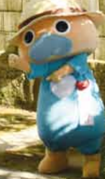
仲村渠樋川と石畳

親田御願、浜御願(ハマウリー)、アミシヌ御願・網曳きなど伝統行事がある仲村渠。網曳きは有名で、区外からも多くの人が訪れるなん。アマミキヨが居を定めたとされるミングスク(私有地)や、国指定文化財の仲村渠樋川など文化資源も豊かな地域なん。