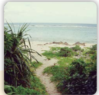
沖より壺が流れ着き、五穀の 種が入っていたそう。 #伊敷浜 # 五穀発祥