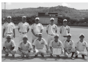
【準優勝】山里チーム