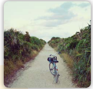
島の最北端への道。 #ケーブル # 自転車が便利 # 神が来た道 # 植物群落