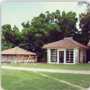
左の建物はイラプー（海蛇） の燻製小屋。 #久高殿 #イザイホーの祭場