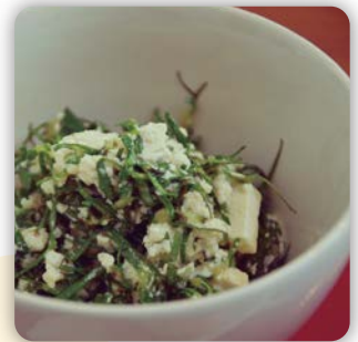
朝ごはんの小鉢のひとつ。 #ニガナ # 島の伝統食 #さわやかな苦味