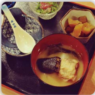
琉球国王も食した滋味。 #イラプー汁 #海蛇 #明日もがんばれそう