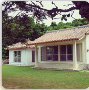
太陽、月、竜宮など七つの 神様を祀っている。 #外間殿