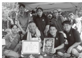
【優勝】新開第二団地チーム