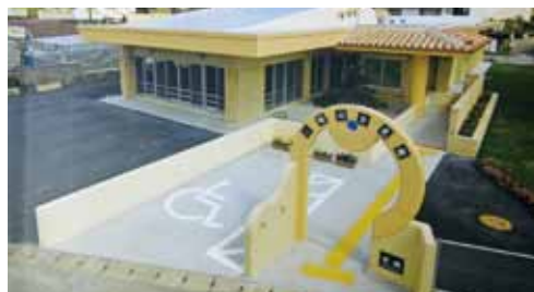
堀川区の新公民館

※公民館建築などの事業費は、区内で建設工事が進んでいる一般廃棄物最終処分場の建設による地元合意の条件付きでの地域振興費から捻出されています。