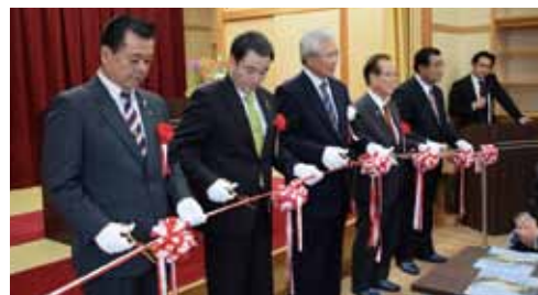
テープカットの様子