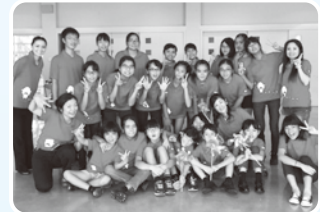
昨年度は市民ミュージカル「太陽の門(ティダヌジョウ)」で大活躍!今年度は定期演奏会を開催予定です。

※部活動と両立したい中学生以上の皆さんのためのカンターピレクラス(年間登録)もあります。