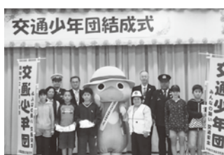
百名小学校での結成式