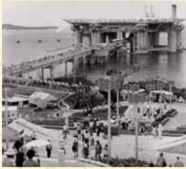
▲海洋博のシンボル「アクアポリス」