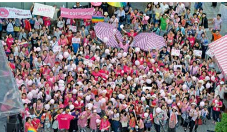
LGBTに関する講座も行っています。詳しくは7面なは女性センターの欄をご覧ください。

次年度以降には、市職員に対する研修や相談窓口の明示など、より一層「レインボーなは」にふさわしいまちづくりに取り組んでいきます。