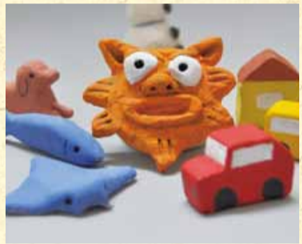
▲木かる粘土でこういったものを作ります