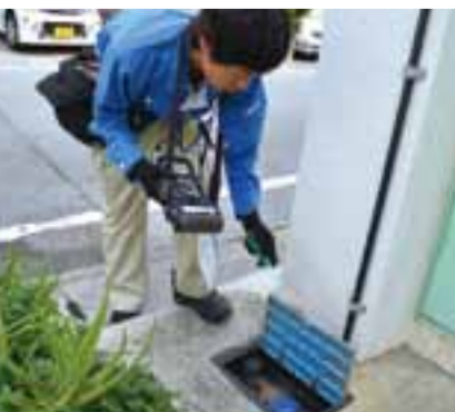
水道使用量が極端に増減すると直接訪問します(協力:太閤建設・第一環境連合体)