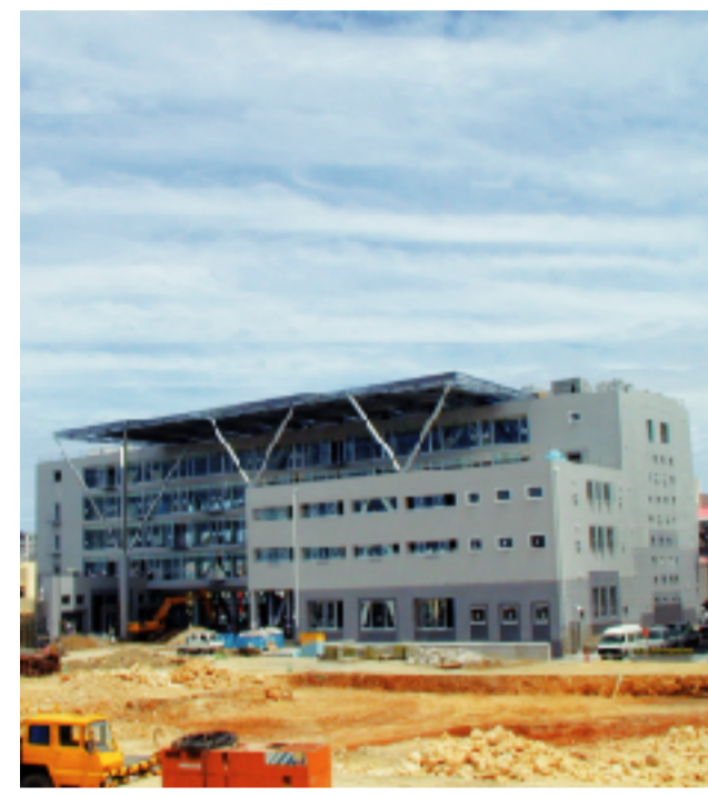
工事が進む新都心銘苅庁舎