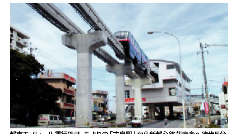
都市モノレール運行後は、もよりの「古島駅」から新都心銘苅庁舎へ徒歩5分