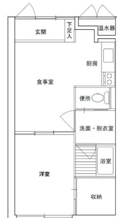
1 Kタイプ (約40㎡) 10戸