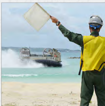
ホバークラフトで発電機車 輸送