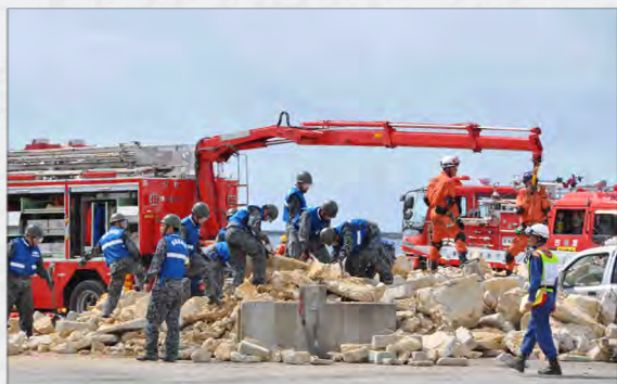
震度 6 弱、津波が発生した想定のもと…