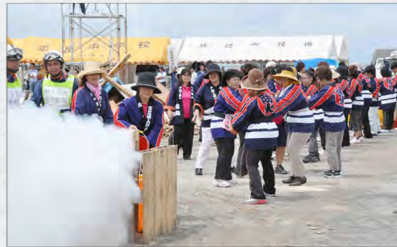
多くの関係機関が集まり様々な訓練を実施