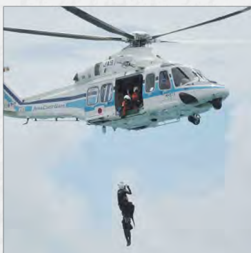
ヘリによる津波の漂流者吊上救助