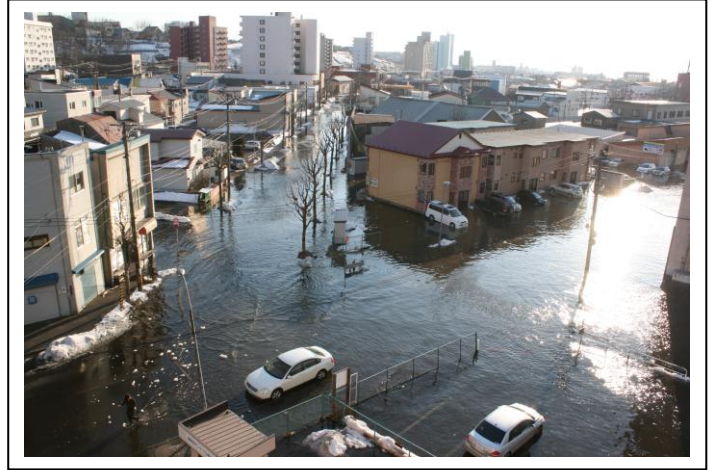
釧路川左岸地区（大町）の浸水状況