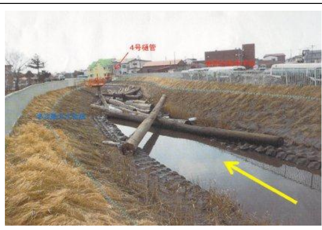
アセツリ川（愛国東）への流木遡上状況