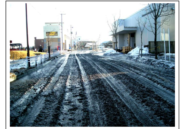
釧路川左岸地区（大川町）の津波堆積物