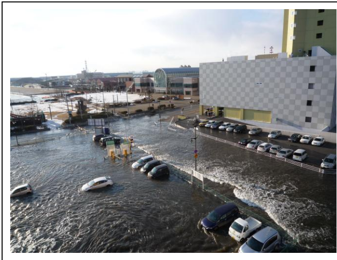
釧路川右岸地区（錦町）の浸水状況