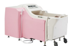
座ったまま入れるお風呂

上記で紹介した製品以外にも、オージー技研の様々な製品が全国の多くの介護福祉施設、医療機関等で利用されています。