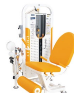
筋カトレニングマシン