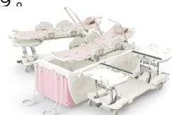
寝たまま入れるお風呂

同社では介護福祉施設などで使う、高齢者に配慮したお風呂も提供しています。高齢者にとっては、お風呂に入ることは危険が伴います。また入浴介助者にとっては、負担の大きいものになります。同社では、双方が安全で負担の少ない入浴ができるよう心掛けています。