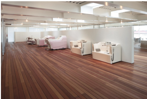
ショールームの様子

東京支店には、ショールームも併設されています。ショールームでは、実際に顧客が製品を見ることができます。介護用の寝たまま入れるお風呂などを、直に触っていただきながら、顧客の要望にかなう製品を提案しています。ちなみに、オシャレな社屋はCMのロケに使われることもあるそうです！