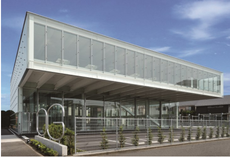
オージー技研 東京支店

甲州街道沿いにあるオージー技研の東京支店は、全面ガラス張りで、オシャレで開放感を感じることができる社屋になっています。なんと、中の会議室もガラス張り…。開設時の2011年にグッドデザイン賞を受賞しています。外から見ると、なんと目を引く建物になっています。近くをお通りの際は是非ご覧あれ。