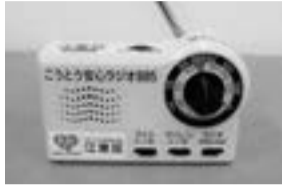
▲防災備蓄用ラジオ