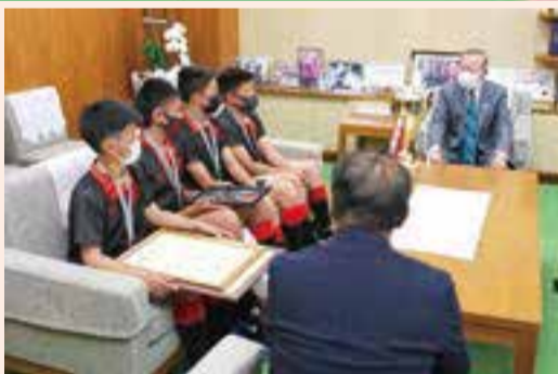
▲キャプテン・バイスカプテンが区長に優勝を報告

4/6、小学生ラグビースクールの全国大会で優勝した「江東ラグビークラブ」の選手4人と監督らが、山崎区長を表敬訪問しました。小学部・高学年(5・6年生)が、昨年11月から12月にかけて行われた関東大会(56チーム出場)を突破し、3年ぶり2度目となる全国大会に出場。クラブ創設初となる全国280チームの頂点に立つ快挙を果たしました。