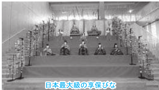
日本最大級の享保ひな

の雑務などの役目を持つ仕丁の製作を検討中です。等身大のひな人形が全部そろつての展示は全国でも例を見ないことから、今後、集客が見込めるものと考えております。また、近隣の御宿町では「まちかどつるし雛めぐり」というイベントを行っています。今後は1市町村だけのイベントではなく近隣市町と連携したイベントとし、観光客の交流を図ってまいりたいと考えています。