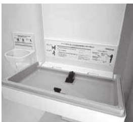
キュステのオムツ交換台

A オムツ交換台については、13施設に18台、授乳室については、こども館に1か所設置している。公共施設におけるオムツ交換台と授乳室の整備は、子育て支援の観点からも重要であり、引き続き必要箇所への設置について検討したい。