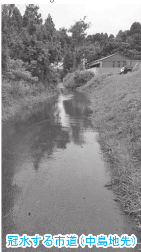
冠水する市道(中島地先)