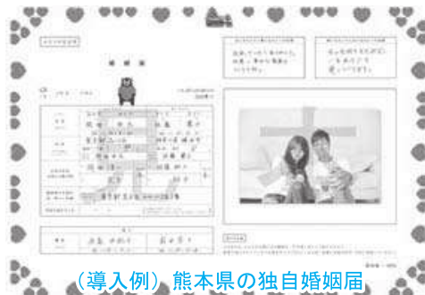
(導入例) 熊本県の独自婚姻届

A ご当地婚姻届の導入については、戸籍法による記載事項を具備した上で、勝浦市独自の婚姻届書の作成をする事は可能である。導入に向け検討する。結婚記念品、ご当地出生届の導入についても、同様に調査検討する。