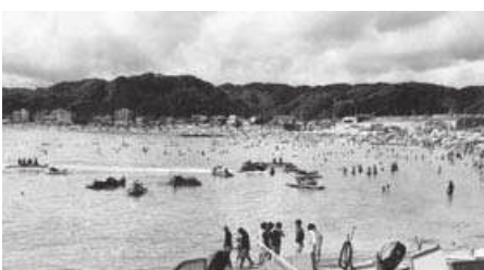
水上バイク等で危険な状況の守谷海水浴場

A 本市の海水浴場においても館山市と同様な問題を抱えており、いすみ市・御宿町・鴨川市と共同して、安全を確保する条例の制定に向け検討しています。