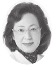
久我 恵子議員 (無会派)