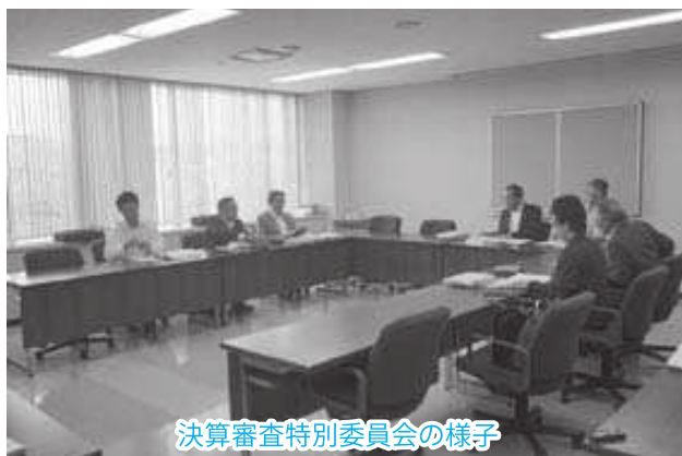
決算審査特別委員会の様子