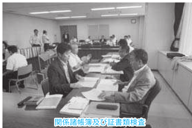
関係諸帳簿及び証書類検査