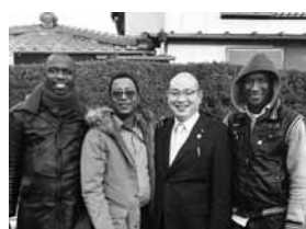
セネガル共和国から勝浦市への漁業研修生

A 現在はオリンピックにおける近隣市町村との連携を前提に、サーフィンド国であるオーストラリア自治体との姉妹都市提携を検討している。