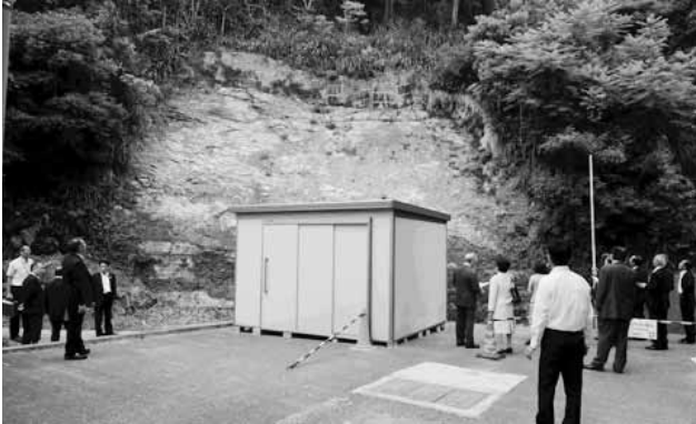
現地視察の様子（勝浦小学校敷地内防護柵設置計画現場）

歳出予算の内 9 款 教育費 小学校費・中学校費 管理運営経費 工事請負費について