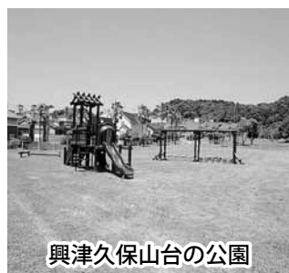
興津久保山台の公園