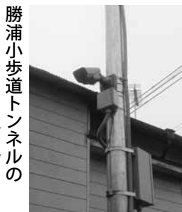
勝浦小歩道トンネルの防犯カメラ

A ①国指定12件、県指定8件、市指定22件。②文化財所在情報の収集、選定、内容の確認等である。③文化財審議会に諮問し、答申を受け、指定している。④必要に応じて補助金を交付するなどの支援を行っている。⑤観光パンフレット等への紹介や勝浦3町の祭り屋台の披露を行っている。⑥「歴史探訪」や「市民歴史散歩」を実施している。