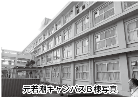
元若潮キャンパスB棟写真