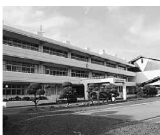
改修された上野小学校