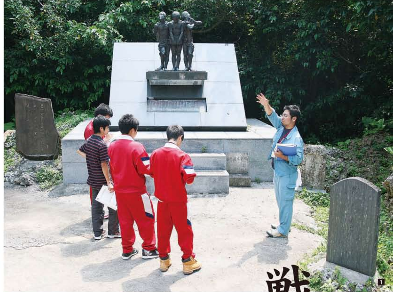
1) 「沖繩師範健児之塔」で市職員から説明を聞く生徒/2) 「開南健児之塔」で石碑に刻まれている人数を数える生徒/3) 「沖繩工業健児之塔」で市職員から説明を聞く生徒/4) 「6」の階段を上り右手奥に立つ「金城語の追悼碑(仮称)」/5) 「沖繩師範健児之塔」後方の境内にある納骨堂/6) 平和祈念公園内にある「島守の塔」近くの階段