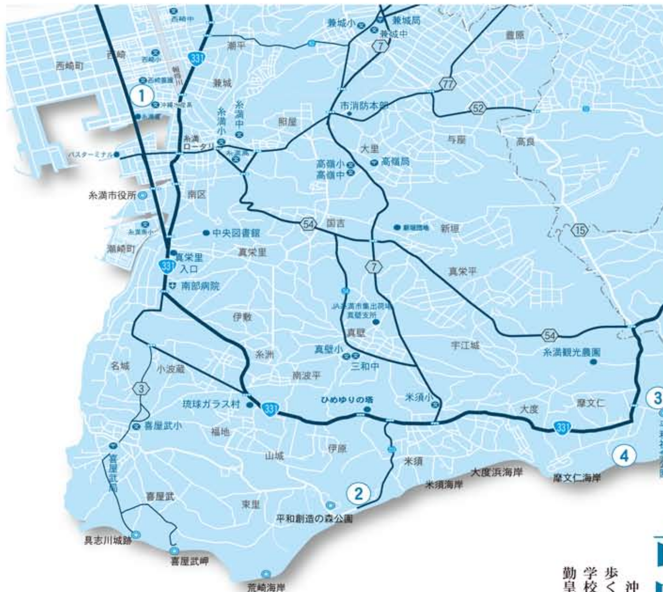
所在地は字山城574番地。平和創造の森公園東側。「因伯の塔」向かい、「魂魂の塔」から南西に約170メートル。

通信隊要員の適性検査に45名が合格。12名が字大里の大城森に駐屯していた第24師団司令部へ配属。家族との面会で一時帰宅後に、部隊と共に首里へ移動。無線部隊は首里久場川や石嶺付近の戦闘状況を本部へ送信。大城森へ撤退後に真栄里集落西側の大隊へ配置換え、さらに国吉集落西側の大隊へ配置換えされ、敵陣地への斬り込みが命じられるが失敗。1945年8月末まで逃げ延びたのちに米軍に收容される。同校は戦後に再開することがなく、創設9年で廃校となる。