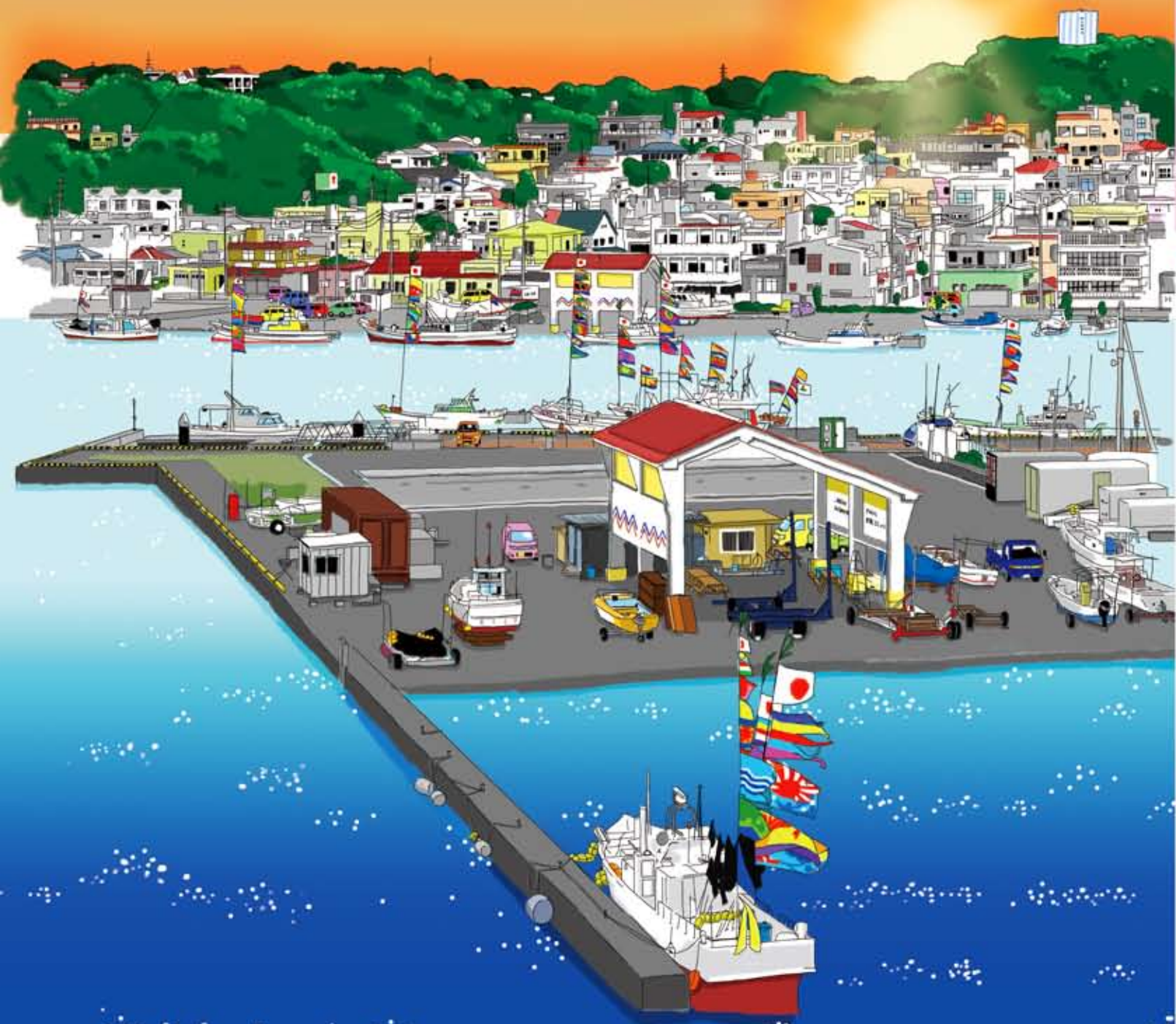
【朝日を浴びる旧正月の港町】 国道331号バイパスから望む糸満漁港