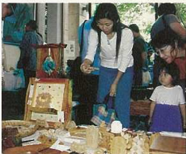
八重山の産業まつりの展示会では、展示即売会も行われた。