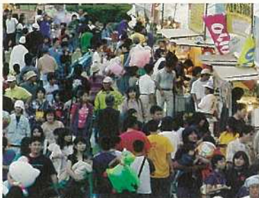
メイン会場の新栄公園には大勢の市民・観光客がぐりだした。

二日目に行われた恒例の市民大パレードには、十四年ぶりとなる旗頭が参加。十三本の旗