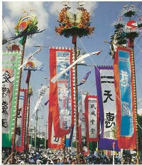
14年ぶりに旗頭も加わりあり、花を添えた。