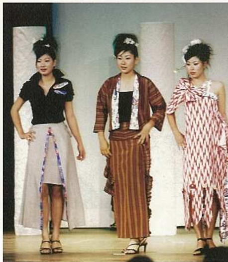
八重山商工高生がモデルをつとめ、自主作品でアピール。