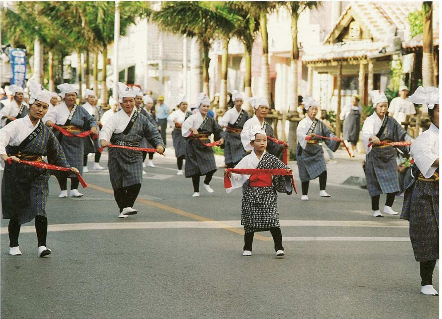
11月7日に行われた石垣島まつりの市民大パレードでは、2,500名が行進。各団体とも趣向をこらし、沿道の観客から大きな拍手や声援を受けました。