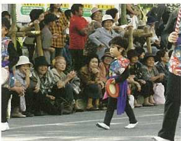
小さな踊り手に沿道から声援が。