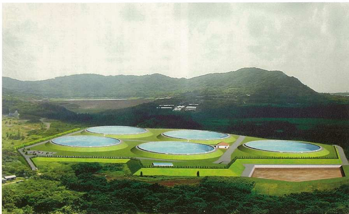
白水原水調整池完成イメージ図。周囲との景観も考慮されている。

十月三十一日、平成十五年四月に変更認可された「石垣市水道事業（第六次拡張事業）の主要事業である白水地区に整備