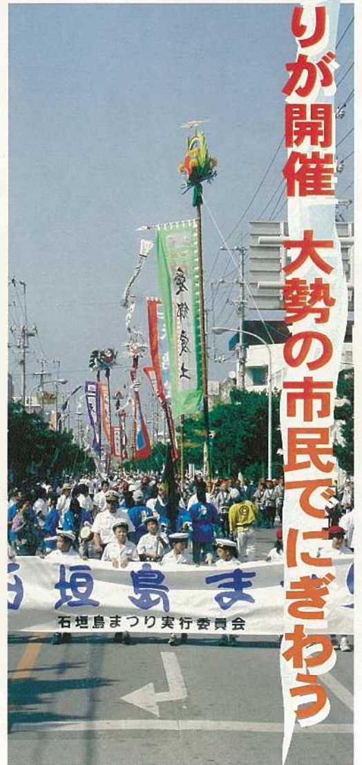
海洋少年団を先頭に約2,500名のパレードが行われた。

頭が並ぶ光景は壮観で、沿道に詰めかけた観客は、力強く旗頭を持つ頭持ちに大きな拍手や声援を送っていました。また、小学校マーチングバンド・鼓笛隊や石垣市婦人連合会、石垣市民踊愛好会など三十七団体二千五百名がパレードし、まつりをもりあげました。また、子どもの踊る姿を収めようと、ビデオやカメラを片手に歩道を必死に走り回る親の姿もあり、それぞれのまつりの楽しみが見てとれました。 新栄公園では、八重山民俗舞踊保存会による郷土芸能の夕べなどが行われる中、楽しい出店の数々を家族や友人と楽しみ、最後に夜空に咲いた大花火で二日間のまつりに幕を下ろしました。