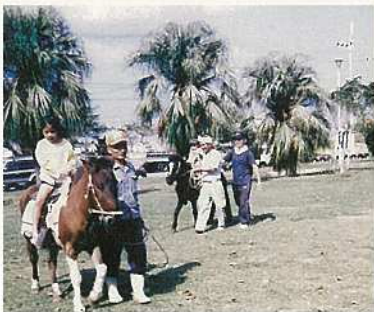
浜崎緑地公園では、乗馬の体験も。