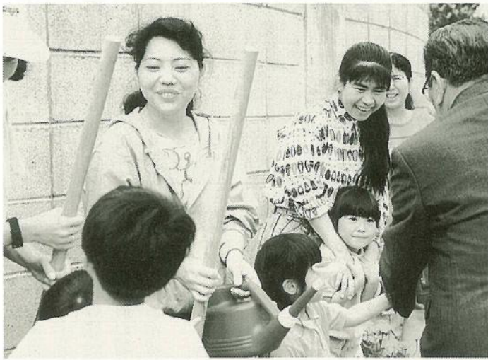
▲和やかな雰囲気の中で花壇づくりをする石垣ベンチャークラブ