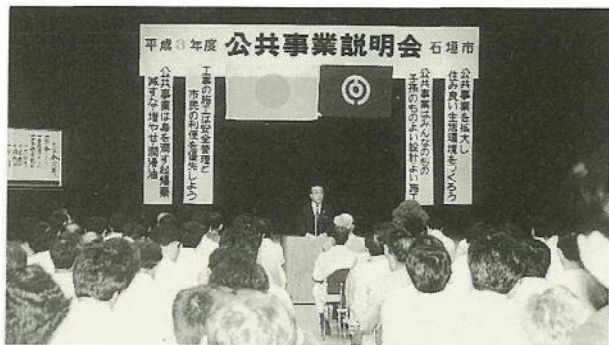
▲約200名余が参加して行われた公共事業説明会

市主催の平成三年度の石垣市公共事業説明会が、四月二十三日午後四時から市民会館中ホールで開催されました。会場には、市内の建設、土木コンサルタント等関係業者二百名余が参加し、熱心に事