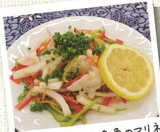
色どり野菜と白身魚のマリネ