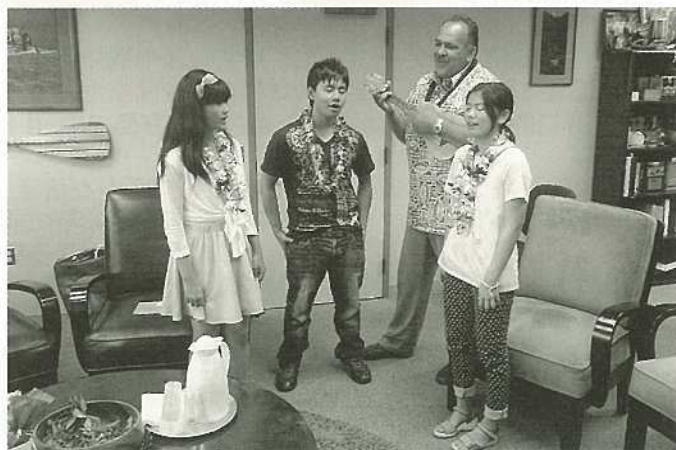
写真：カウアイ郡長とセッション