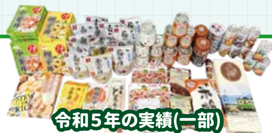
令和5年の実績(一部)

家庭で余っている食品を持ち寄り、それを必要とする人に使っていただく活動です！ 回収した食品は、市の福祉部署を通じ、生活が困窮している方へ配布をしました。