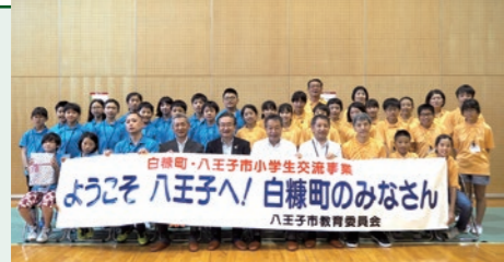
夏休みの思い出に(写真は令和元年度の様子)