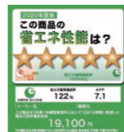
統一省エネラベル