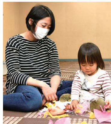
親子遊びや体操なども

対 小学生のお子さん(来年少生になるお子さん)の保護者 日 6月22日(水)午前10時～11時30分 時 会クリエイトホール 定 15名(抽選) 申 ハガキ、ファックス、メールに「クリエイトフィーカ」と住所・氏名(ふりがな)、お子さんの年齢・電話(ファックス番号)を書いて、6月17日(必着)までに学習支援課(〒192・00082東町5・6 ☎648・2231 ☎648・2151 ☎R203000@city.nishiojcity.jp)へ