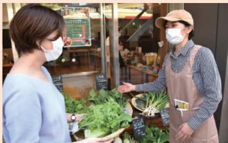
さまざまなまちの魅力を再発見

対 市内在住で60歳以上の方 日 6月23・30日、7月7・14・21日の午後2〜4時(全5回。21日は1時から) 申 6月1日から直接または電話で中央図書館(☎644・4321)へ