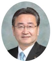
八王子市長 たかゆき