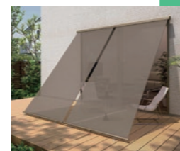
外付け日よけ