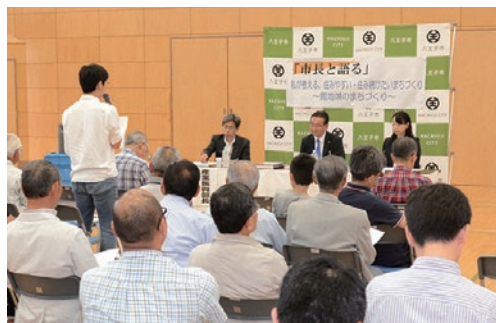
まちへの思いを提案