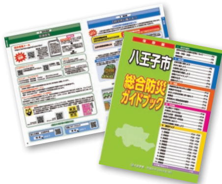
総合防災ガイドブックで地域の状況を確認

道路の雨水ますや側溝がふさがっていると、雨水が流れ込まず、浸水の危険性が高まります。ごみを捨てたり、上に物を置かないようにしましょう。また、河川や水路に障害物などがあると、水の流れを妨げてしまい危険です。お近くの水路に異変があれば、水環境整備課(☎620・7388、☎626・3019)までご連絡を。