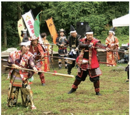
甲冑姿で演武を披露

内容 武者揃え、鉄砲隊による火縄銃の実演、演武、甲冑体験、乗馬体験など 日時 6月23日(日)午前11時〜午後3時 会場 八王子城跡御主殿、八王子城跡ガイダンス施設、屋外模造広場