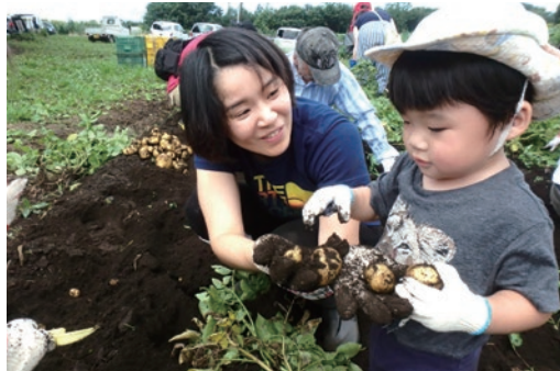
収穫の楽しさを体験