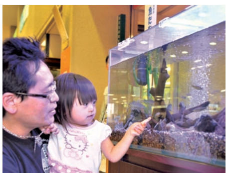
どんな魚がいるのかな

申 ハガキ、ファックス、Eメールに「白糠交流応募」と本人の応募動機(100字以上)、住所・氏名(ふりがな)・生年月日・学校名・学年・性別・電話番号・保護者の氏名を書いて、6月14日(必着)までに生涯学習政策課(〒192-8501 ☎620・7334、☎626・8554、✉f320700@city.hachioji.tokyo.jp)へ