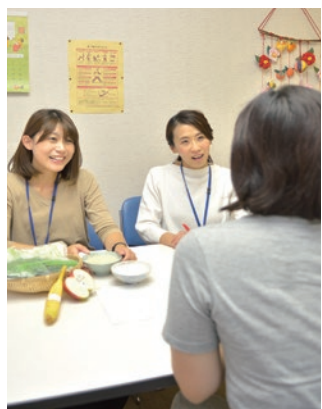
健康づくりのアドバイスも

☎市内在住で40～74歳の方 ☎6月19日(水)午後1時30分～3時 ☎会南大沢保健福祉センター ☎定10名(先着順) ☎申6月3日から電話で南大沢保健福祉センター(☎679・2205)へ