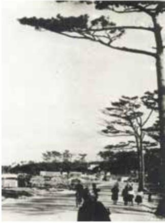
▲ 高校前通り 1951(昭和26)年

琉球王国時代に植えられた見事なりユウキユウマツがまだ残っており目を見張ります。また、前方奥には普天満宮があります。普天間権現のある普天間は、琉球王国