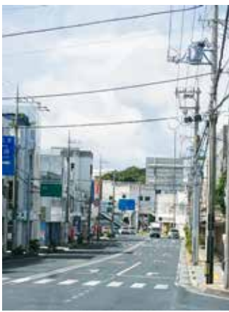
▲ 現在の高校前通り 2018(平成30)年