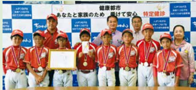
第10回中部南支部学童軟式野球大会にて準優勝し、 第33回とびうお少年野球大会へ出場 宜野湾レッドシャークスの皆さん