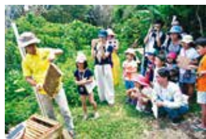
▲ましきわくわく! まちたんけん事業

▶チブ川及びチブ井保存事業 ▶宜野湾市情報発信事業 ▶応急手当絵本作成事業 ▶歴史文化発信!み～ぐるぐる宜野湾 ▶フラワーロード事業 ▶ましきわくわく!まちたんけん など