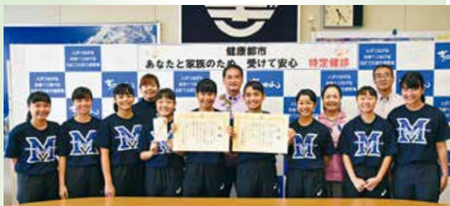
第30回ビーチバレーOKINAWA2018にて優勝と 準優勝を勝ち取り、第9回湘南藤沢カップ 全国中学生ビーチバレー大会出場 真志喜中学校バレー部の皆さん