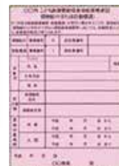
▲新受給資格者証 (イメージ)