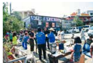
▲フラワーロード事業