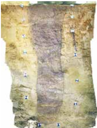
剥ぎ取りを行った大型土坑