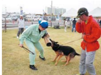
デモンストレーション