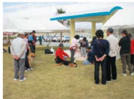
しつけ相談の様子