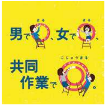
男女共同参画週間 平成29年度キャッチフレーズ