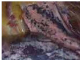
▲内視鏡で撮影した健康な肺(上)、がんに侵された肺(下)