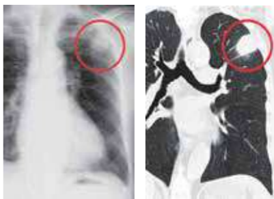
▲肺にできたがんの腫瘍を写したレントゲン写真(左)、CTによる写真(右)