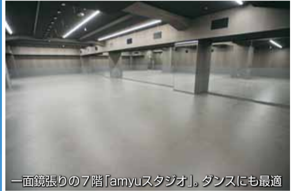
一面鏡張りの7階「amyuスタジオ」。ダンスにも最適