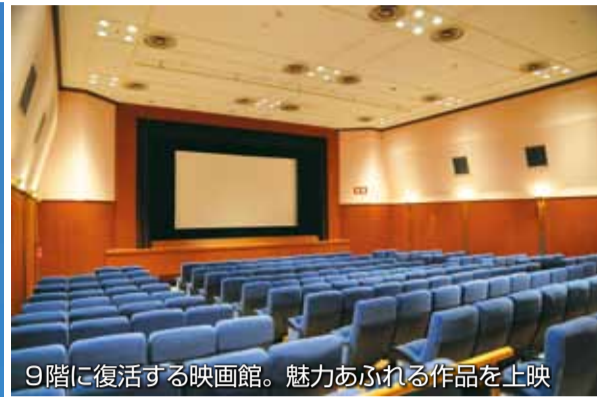
9階に復活する映画館。魅力あふれる作品を上映