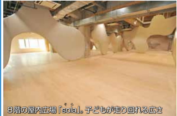
8階の屋内広場「sola」。子どもが走り回れる広さ