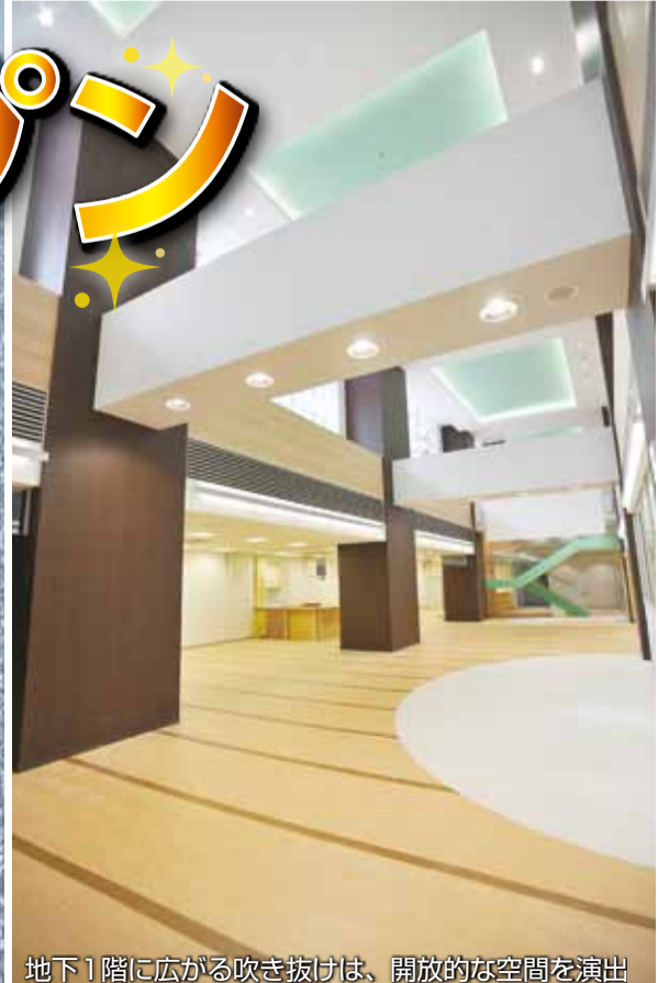
地下1階に広がる吹き抜けは、開放的な空間を演出