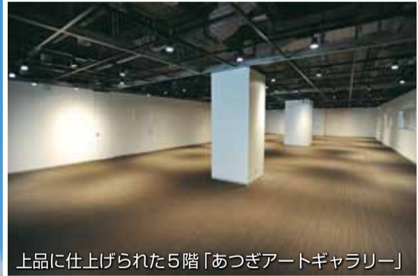
上品に仕上げられた5階「あつぎアートギャラリー」