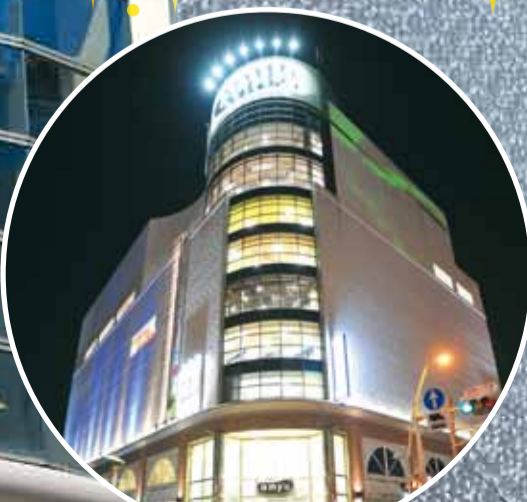
夜間はきらびやかなイルミネーションが点灯

—地下1階～4階のショッピングフロアと9階の映画館は、4月24・25日の2日間、11時～17時に限りプレオープンします。