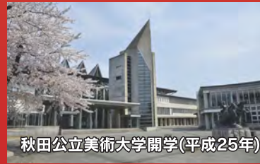
秋田公立美術大学開学(平成25年)