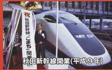
秋田新幹線開業(平成9年)