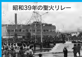
昭和39年の聖火リレー