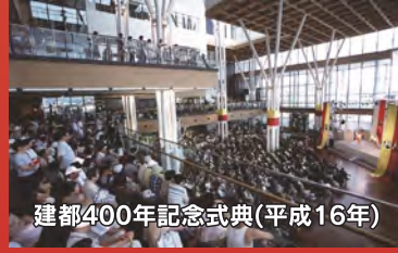
建都400年記念式典(平成16年)