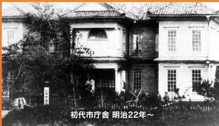
初代市庁舎 明治22年～