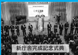
新庁舎完成記念式典