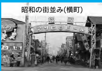
昭和の街並み(横町)