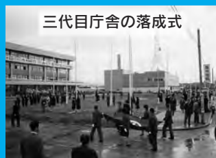
三代目庁舎の落成式