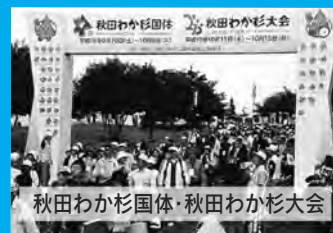
秋田わか杉国体・秋田わか杉大会