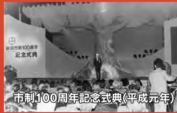
市制100周年記念式典(平成元年)