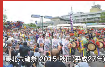
東北六魂祭 2015 秋田(平成27年)