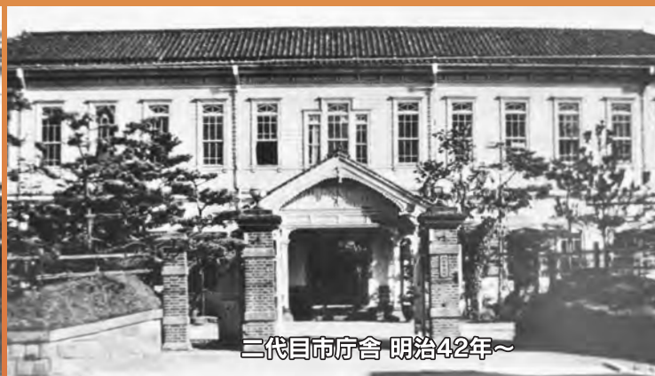
二代目市庁舎 明治42年～