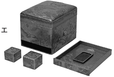
国宝〈初音の調度〉のうち 〈初音時絵旅櫛箱〉 霊仙院千代姫 (尾張家2代光友正室)所用 江戸 時代・寛永16年(1639) 前期展示

本展では、家康ゆかりの品や三代将軍家光の娘・千代姫の婚礼調度である国宝「初音の調度」など、徳川美術館の所蔵品の中から選び抜いた名品により、尾張徳川家の歴史と華やかな大名文化を紹介します。