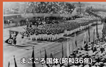
まごころ国体(昭和36年)