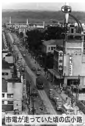
市電が走っていた頃の広小路