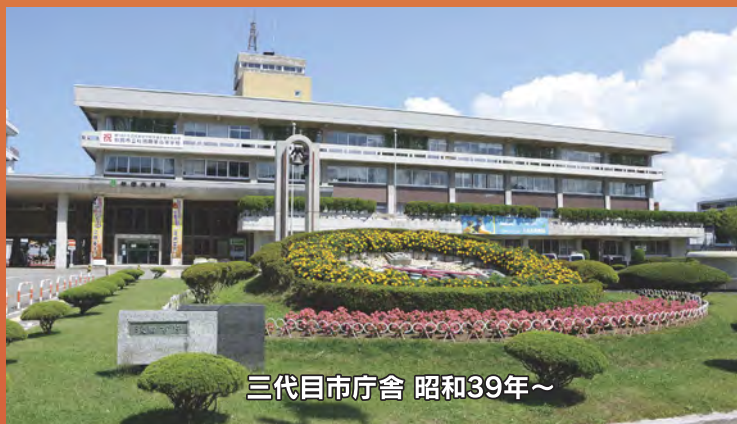
三代目市庁舎 昭和39年～