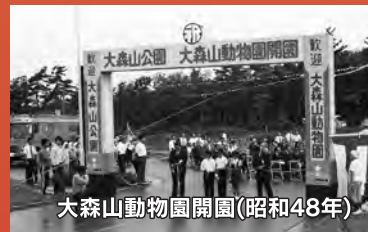
大森山動物園開園(昭和48年)