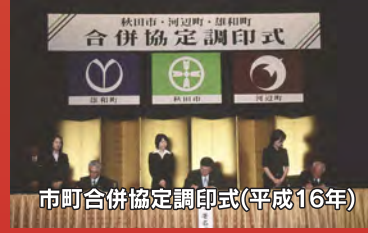
市町合併協定調印式(平成16年)