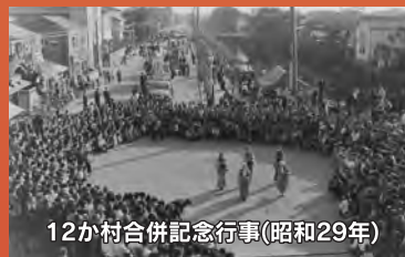
12か村合併記念行事(昭和29年)