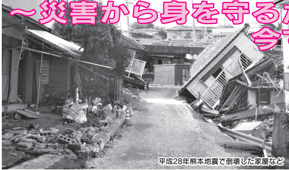
平成28年熊本地震で倒壊した家屋など

九州地方を襲った平成28年熊本地震では、家屋の倒壊や大規模な土砂崩れなどにより、多くの方が被災し、長期間の避難生活を強いられています。「今できること」「家族でできること」などについて考え、日頃から災害への備えを心掛けてみましょう。また、備蓄品や避難生活に必要なものを準備しておきましょう。