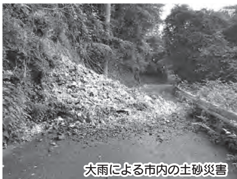
大雨による市内の土砂災害

▽「東京防災」の活用 「東京防災」は、首都直下型地震を想定して東京都が作成し、全戸配布した防災に関する黄色い小冊子です。地震以外の災害にも対応していますので、事前にも確認し、いざという時の参考にしましょう。