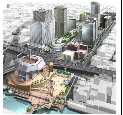
※現地概要図(実際の建物との違いがあります)