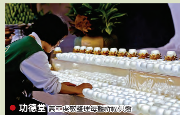
● 機動組 方丈和尚關懷外籍義工