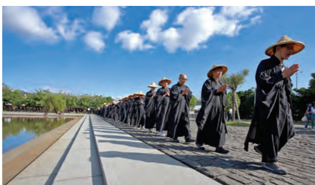
▲農禪寺共修信眾沿水月池繞佛。