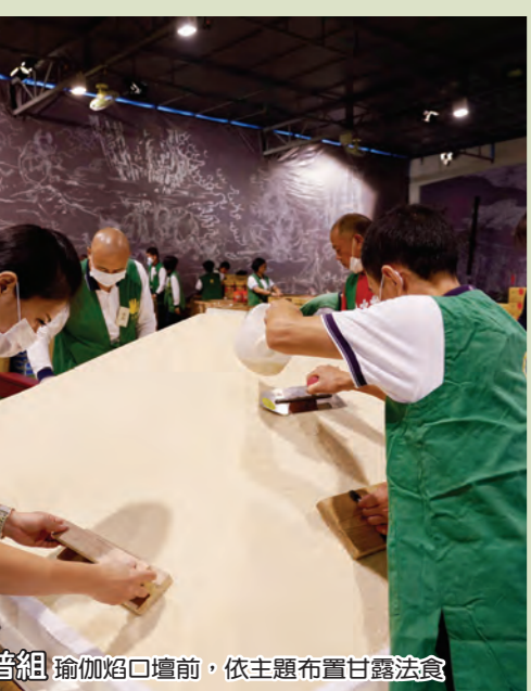
● 機動組 方丈和尚關懷外籍義工