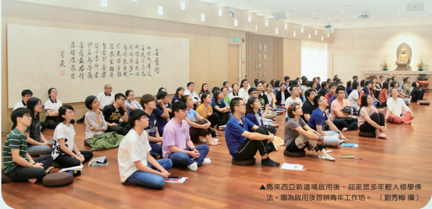
▲馬來西亞新道場啟用後，迎來眾多年輕人修學佛法。圖為啟用後首辦青年工作坊。

長時間與靈感奮鬥，我學會了抽離，轉換身分去協助、體會和同理其他組別的義工，發現大家執行任務時，同樣有要面對的難題。我們互相分享關懷，頓時覺得不是自己一人，而是很多人相伴在同一條路上，回到電腦前，事情就變得事半功倍了。