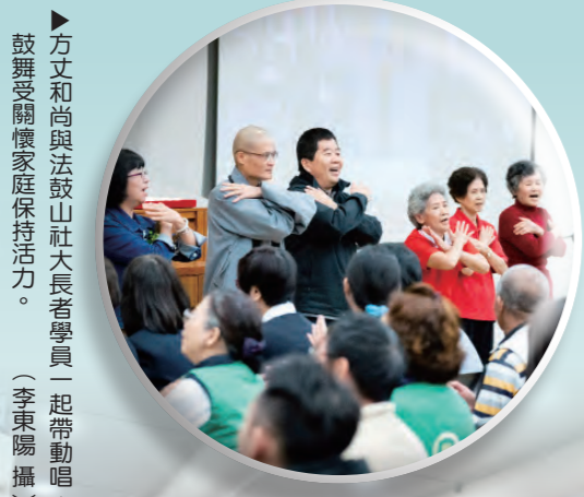
方丈和尚與法鼓山大長者學員一起帶動唱，鼓舞受關懷家庭保持活力。