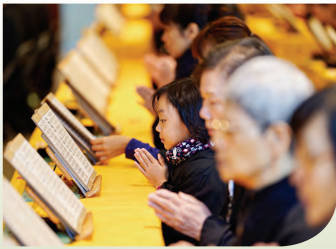
▲學佛不分年齡，在壇場隨大眾誦經、禮拜，同得安定、自在與法喜。