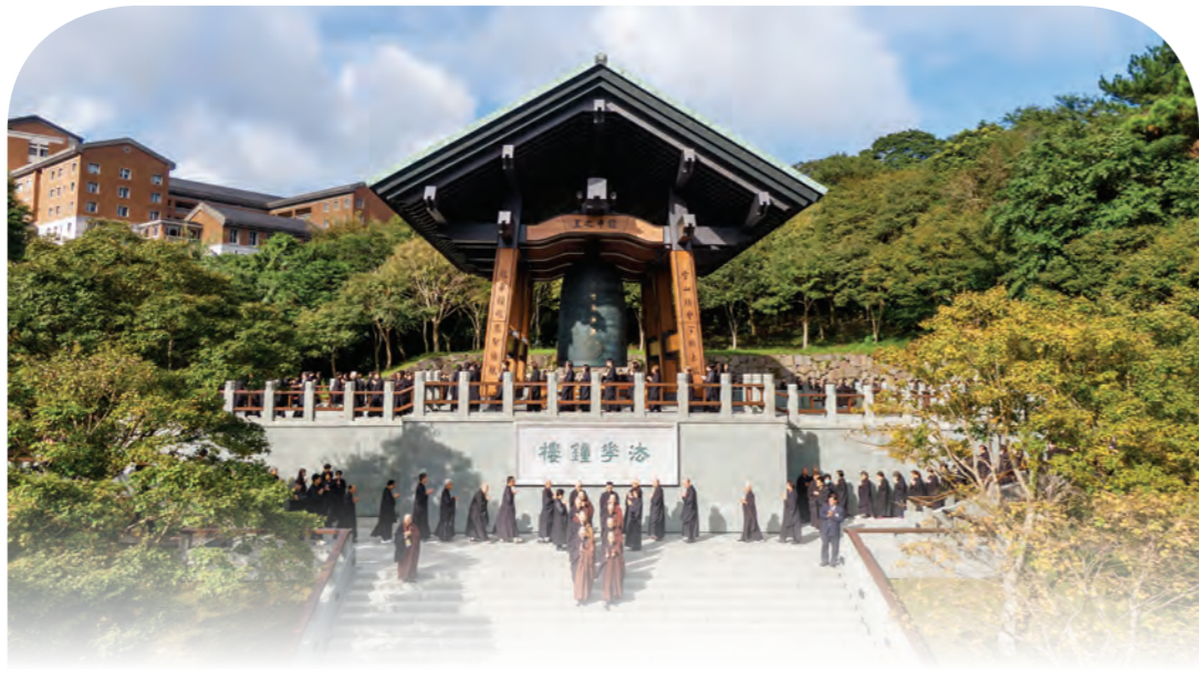
►法華大義，開權顯實，妙不可言。法華鐘樓繞佛梵音，如一條無形的線，繫繫大眾願心。