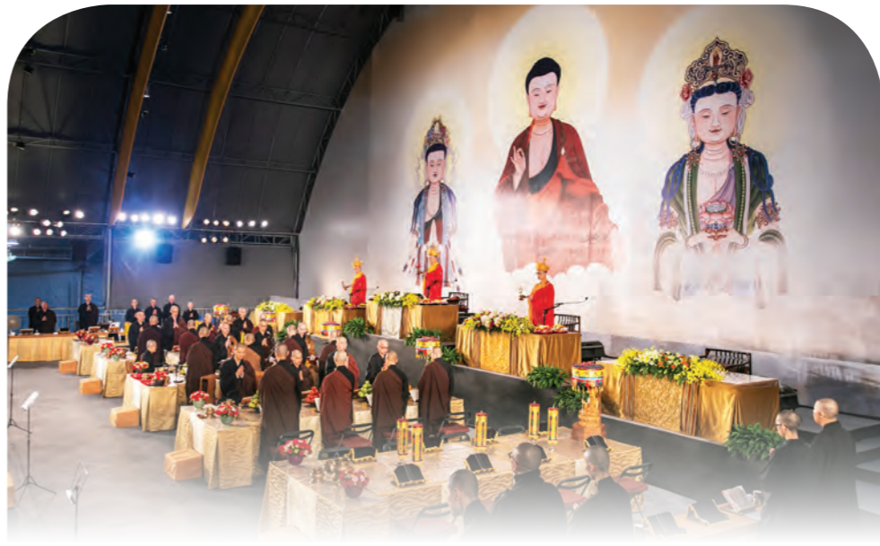
►瑜伽焰口法會在佛菩薩慈願力加持下，仗金剛上師三業相應，在場諸師大眾同發悲心，廣度群靈，普濟眾生。