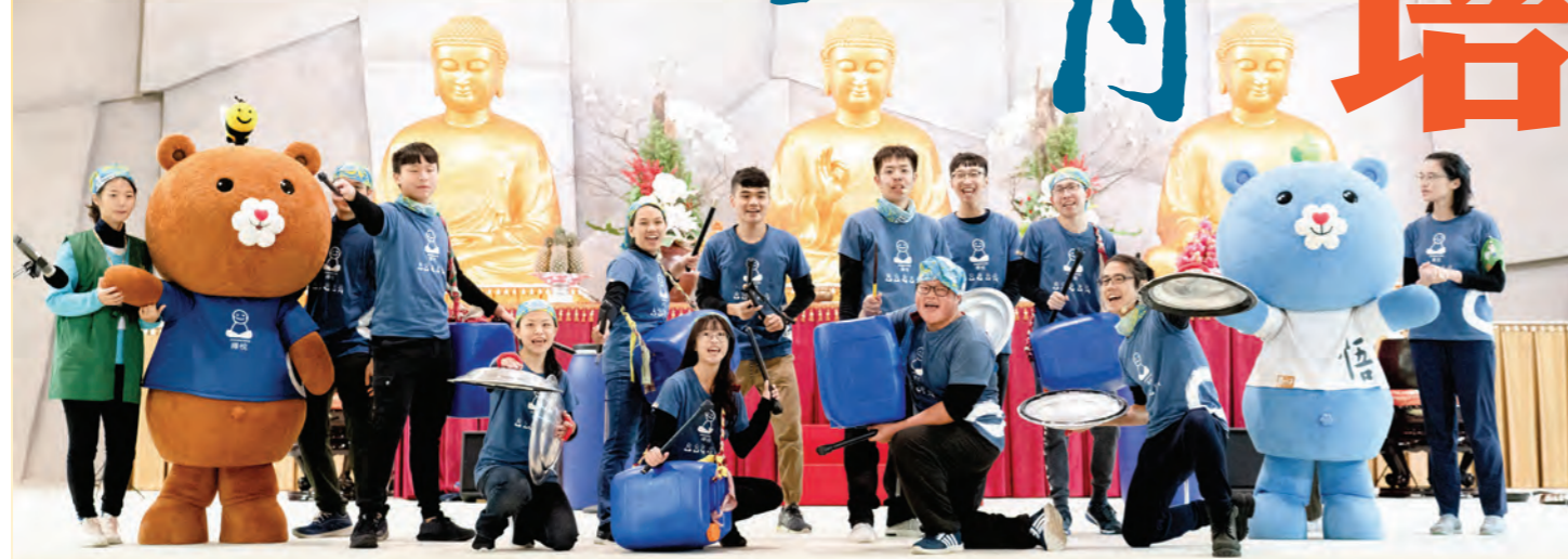
▲農禪寺歲末關懷活動中，法青們以銅碗瓢盆為樂器，為受關懷戶帶來充滿活力的祝福。

年輕，正是精進修行、培福修慧的好時光，去年（二〇一九）歲末，法青菩薩們投入水陸法會送聖、普請，於歲末關懷活動中，以實際行動傳送祝福，共行自利利人的菩薩道。 ◎楊雅穎