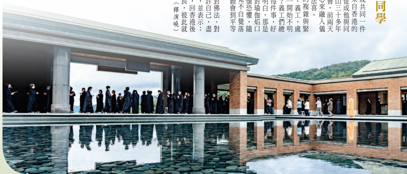
▲祈願壇在新願觀音殿池畔繞佛，一心誦持〈大悲咒〉，當下即是慈悲道場。