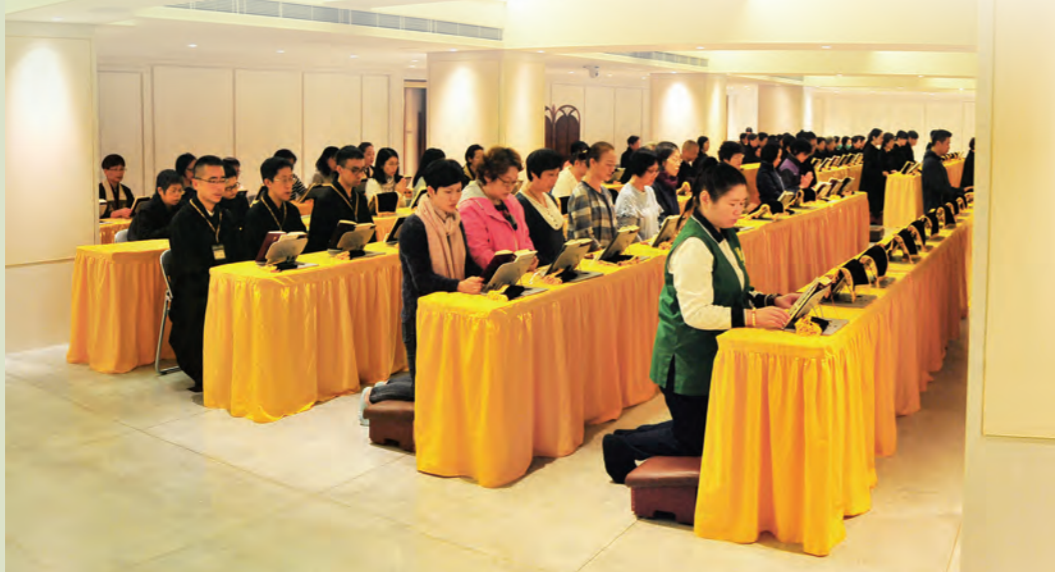
▲信眾踴躍前往香港道場參與網路連線共修，即使身在海外，同樣感受到法會的莊嚴安定。

►法會當日因重大交通事故，管制溫哥華道場聯外道路，七十餘位信眾畏低溫，冒雨步行至道場，一心為眾生禮懺祈福。