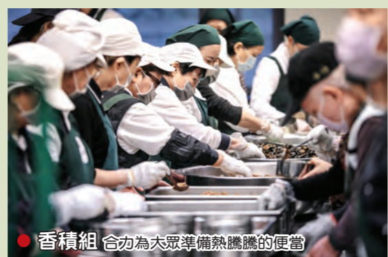
● 功德堂 義工虔敬整理每盞祈福燈