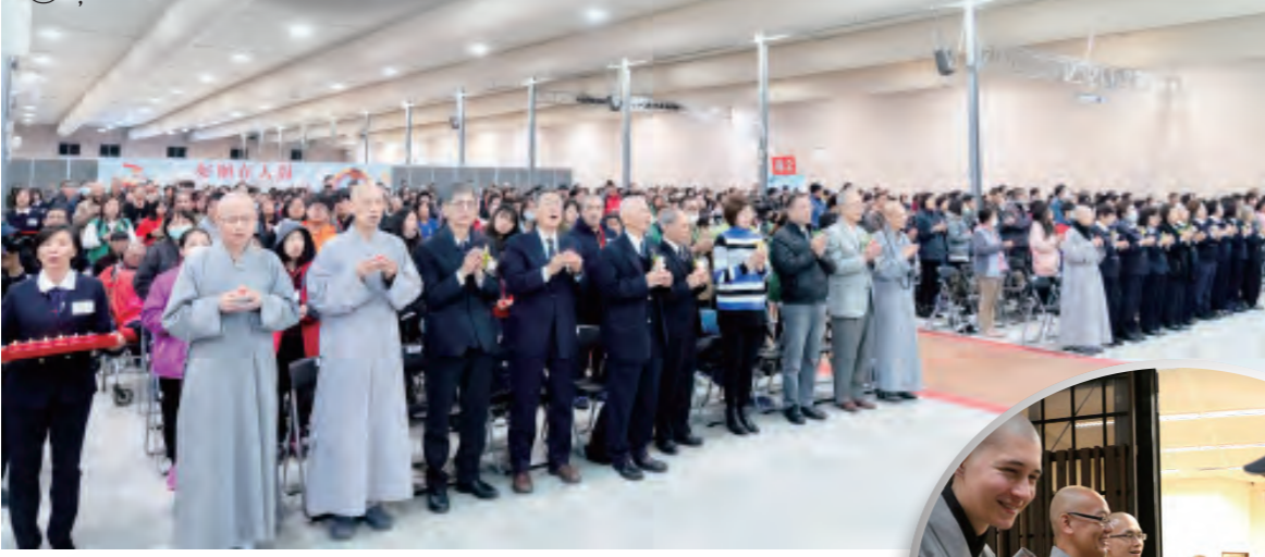
農禪寺歲末關懷中，法師們引領受關懷戶祈福供燈，為自己與他人送上祝福。