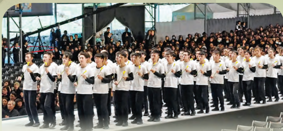
一百位法青同學手執百合，以虔誠願心齊步走上成佛之道。