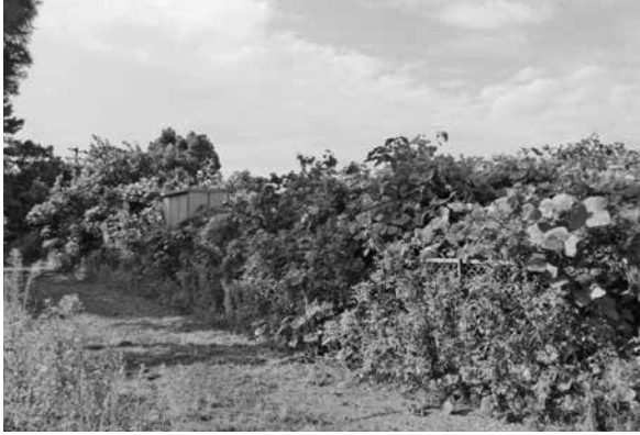
クロマツ植樹前の圃場