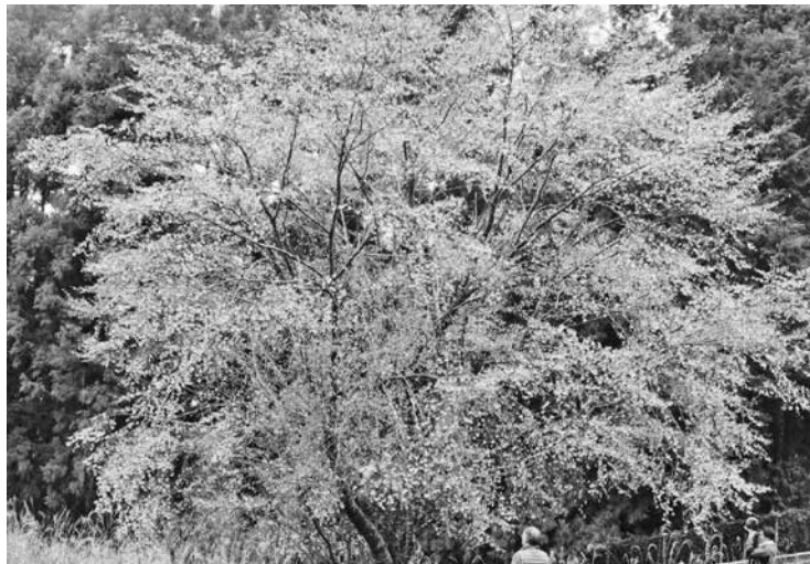
図3 自生地で満開のクマノザクラ（長尾美春桜）