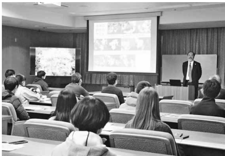
図2 勝木俊雄博士による記念講演