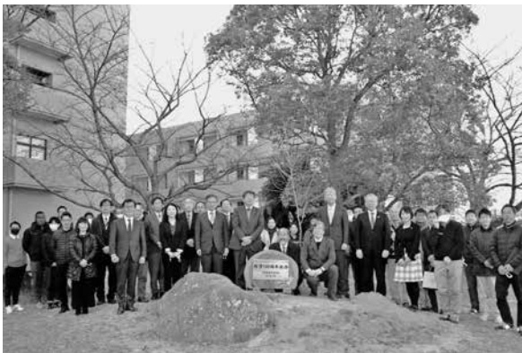
クマノザクラ記念植樹