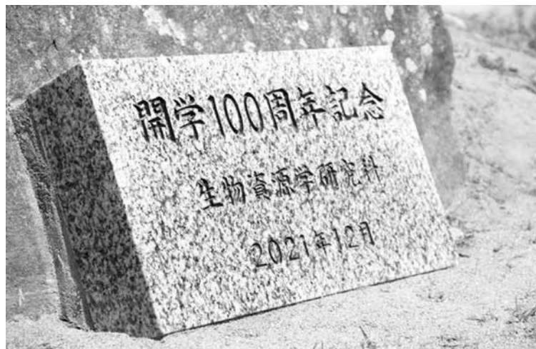
三翠同窓会から寄贈いただいた石碑