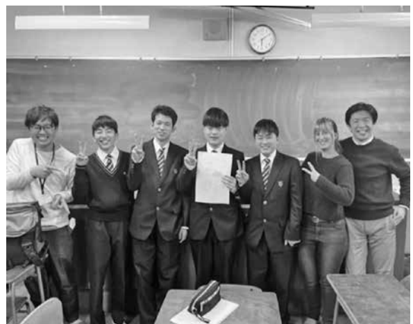
図1 京都府立東舞鶴高校科学部

同杉山地区は良質な名水が湧き出る地域として、環境省の名水百選に選抜されている 3) 。湧水