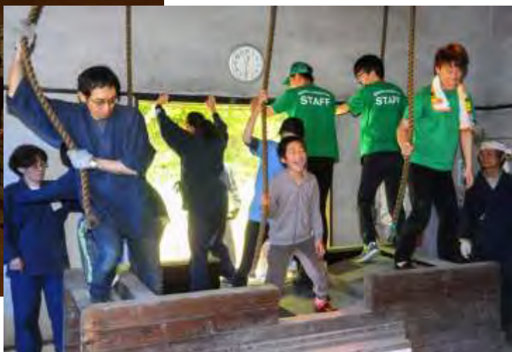
昨年の「古代たたら鉄づくり体験」の様子(2017年5月14日撮影)

春の恒例行事「古代たたら鉄づくり体験」を開催します。中国山地文化の象徴である日本古来の製鉄法「たたら製鉄」の感動をより多くの方々と共有し、往古から続くこの「たたら製鉄」の技術を守り、伝えていくことを大切な使命と考え、平成7年の開園以来、地域をあげて毎年継続して行われてきた貴重な行事です。今後も出来るだけ多くの皆様方にご参加いただき、この歴史と技術と「ものづくり」の精神を次の世代に伝えるべく取り組んでいきます。