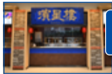
麻婆豆腐もエビチリもマ ンゴー杏仁プリンもこ こで買える